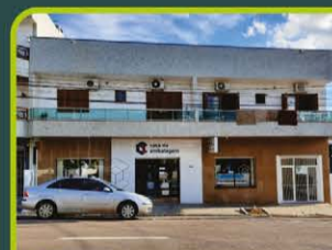
APTO RUA 28 DE SETEMBRO

01 dorm, sala, cozinha, área de serviço, banheiro, terraço e box. R$ 780,00 + encargos L-AP-117