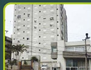
ED. TORRES DA INDEPENDÊNCIA

02 dorm, banheiro, sala de estar/jantar, cozinha, área de serviço, churrasqueira, lavabo, vaga de estacionamento e sacada. Valor: R$ 1.250,00 + encargos L-DP-012