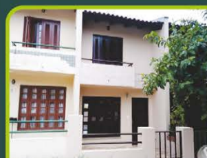
DUPLEX BAIRRO SANTO INÁCIO

02 dorm, banheiro, sala de estar, cozinha, área de serviço, sacada fechada e box. Valor: R$ 1.100,00 + encargos L-AP-114