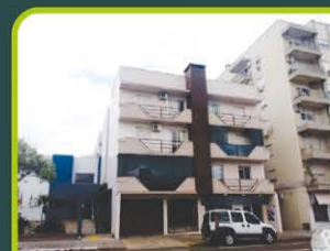
ED. DOM ALBERTO

Dorm/ sala de estar/ cozinha/ área de serviço, banheiro e sacada. R$ 700,00 + encargos L-AP-116