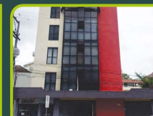
SALA ED. CENTRO MÉDICO

Sala com 11,6m², banheiro, recepção, interfone, alarme, internet. Valor: R$ 880,00 + encargos L-SLC-021