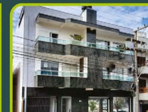
APTO R. 28 DE SETEMBRO N° 1.444

03 dorm, (01 suíte), 02 banheiros, sala de estar/jantar, cozinha, área de serviço, sacada, despensa e churrasqueira. R$ 1.500,00 + encargos L-AP-119