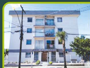
ED. ALFA OMEGA

01 dorm, sala, cozinha, área de serviço, banheiro, terraço e box. R$ 780,00 + encargos L-AP-117