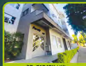
ED. PARATY (JK)

Dorm/ sala/ cozinha/ área de serviço, banheiro e box. R$ 590,00 + encargos L-AP-180