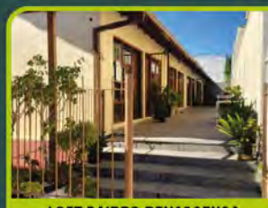
LOFT BAIRRO RENASCENÇA

(MOBILIADO) - 01 dorm, sala de estar, cozinha/ área de serviço c/ churrasqueira, banheiro, sacada e box. R$ 1.850,00 + encargos L-AP-182