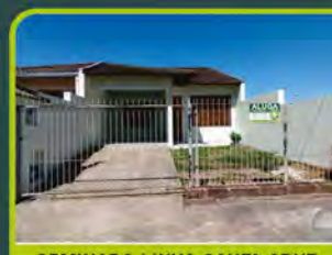
GEMINADO LINHA SANTA CRUZ

02 dorm, banheiro, sala de estar/ cozinha/ área de serviço, sacada e box. Valor: R$ 590,00 + encargos L-AP-095