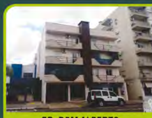
ED. DOM ALBERTO

03 dorm (1 suíte), 02 banheiros, sala de estar/ cozinha, área de serviço, churrasq, garagem e pátio. Valor: R$ 1.100,00 + encargos L-AL-026