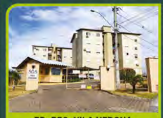
ED. RES. VILA VERONA

02 dorm, banheiro, sala de estar/ jantar, cozinha, área de serviço, sacada e box. Valor: R$ 680,00 + encargos L-AP-149