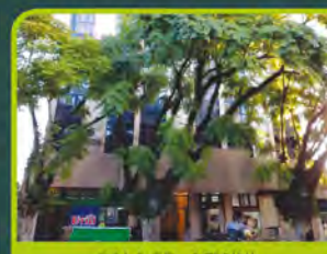
SALA ED. GEMINI

02 dorm, banheiro, sala de estar/ cozinha, área de serviço e sacada. Valor: R$ 530,00 + encargos L-AP-056