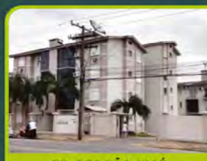
ED. RES SÃO JOSÉ

01 dorm, banheiro, sala de estar, cozinha, área de serviço e sacada c/ churrasqueira. Valor: R$ 720,00 + encargos L-AP-112