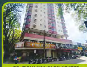
ED. TIPIANAS PARK CENTER

Dorm/ sala/ cozinha/ área de serviço, banheiro e box. R$ 590,00 + encargos L-AP-180