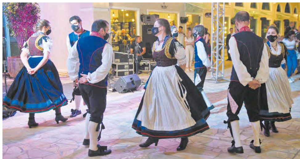
Grupo folclórico animou ainda mais a programação