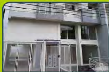
ED. COZUMEL (JK)

Dorm/ sala estar/ cozinha/ área de serviço, banheiro e sacada. R$ 650,00 + encargos L-AP-190