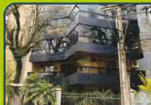
ED. SOLAR ATLÂNTAS

01 dorm, banheiro, sala estar/ cozinha/ área de serviço, churrasqueira e garagem. Valor: R$ 750,00+ encargos L-ap-179