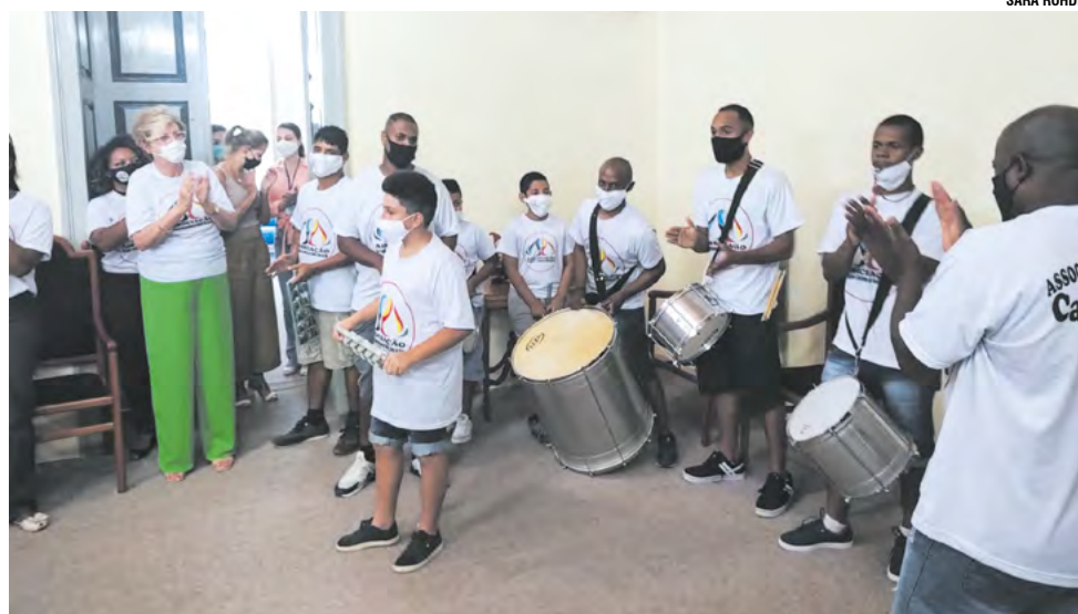
Detalhes oficiais foram apresentados no Salão Nobre do Palacinho na última terça-feira