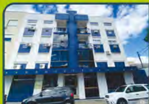
ED. ARUBA (SEMIMOBILIADO)

03 dorm(01 suíte), 3 banh., sala estar/jantar c/ lareira, cozinha c/ churrasq. área de serviço, dep. empregada, sacada e box duplo. R$ 4.000,00+ encargos L-AP-020