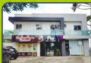
APTO EM LINHA SANTA CRUZ

01 dorm, sala estar/ jantar, cozinha, área de serviço, sacada, churrasqueira, banheiro e box. R$ 750,00 + encargos L-AP-163