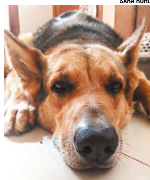
Animais têm audição mais aguçada que os humanos, por isso sofrem com os estampidos dos fogos de artifício

da perturbação do sossego público, também é prejudicial aos animais de estimação como cães e gatos, e animais silvestres. Pessoas que presenciarem o descumprimento da lei podem relatar o caso à própria secretaria durante o horário de expediente pelo telefone 3713-8242 ou através da Guarda Municipal pelo telefone 153. Para validar, as denúncias devem conter fotos ou vídeos.