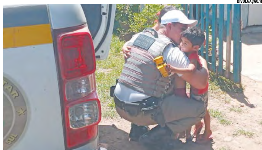
Ação possibilitou levar o espírito de Natal aos pequenos

A intenção foi levar a comunidade para perto do policiamento. “Que se