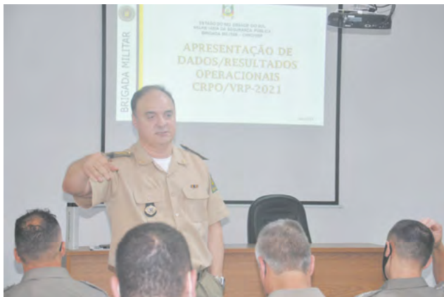
Coronel Reis divulgou os resultados considerados positivos pelo CRPO/VRP

dade diária perfaz os indicadores de 101 operações integradas; 4.059 apreensões de diversos itens; 190 armas de fogo apreendidas; 155.535 pessoas abordadas/identificadas; 2.809 propriedades rurais vistoriadas, fiscalizadas ou inspecionadas; 22.951 estabelecimentos visitados, fiscalizados ou inspecionados; e 76.497 veículos fiscalizados. Em relação aos entorpecentes, foram apreendidos 118 quilos entre cocaína, maconha e crack. Quanto a valores em espécie, foram apreendidos