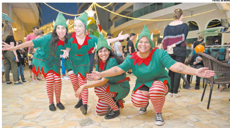
A alegria dos duendes no Natal do München