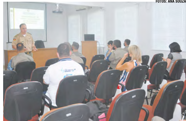
Coletiva, com apresentação dos índices, ocorreu na manhã de quinta-feira, 30

Como pontos fortes de 2021, foram enfatizadas a formação de 107 soldados e 89 sargentos do Polo Regional de Ensino em Rio Pardo e a implantação da Vigilância Colaborativa na área do CRPO/VRP. Atualmente, são 123 câmeras incluídas no sistema nos municípios de Santa Cruz do Sul e Vera Cruz, através da BM e Ministério Público.