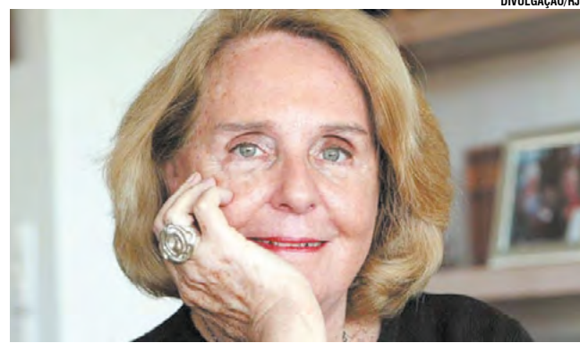
Lya Luft faleceu nessa quinta-feira, em Porto Alegre

A prova de seu amor por sua cidade natal ocorreu também em 2003, quan-