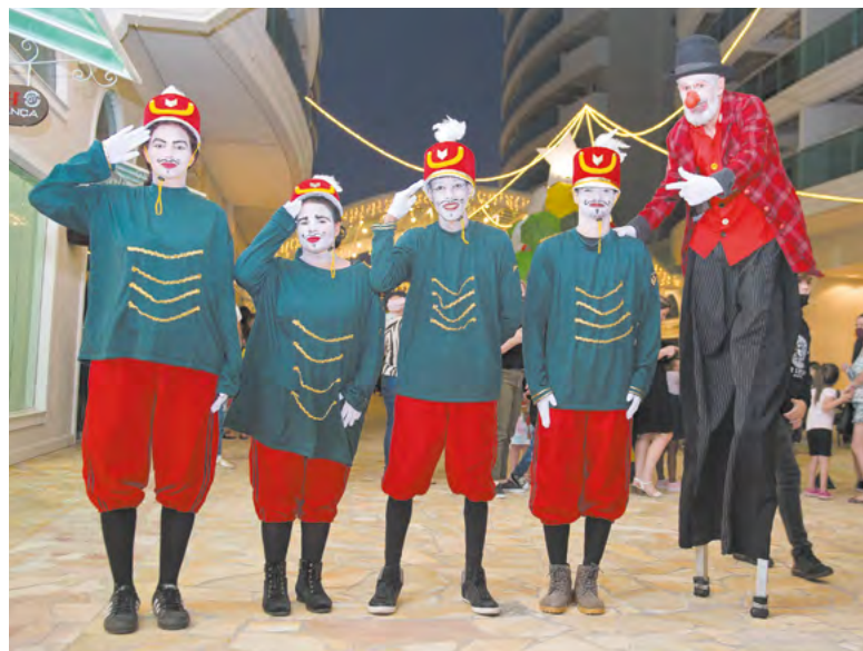
Soldadinhos de Chumbo e Perna de Pau foram alguns dos atrativos do evento