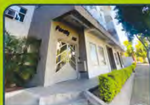
ED. PARATY (JK)

01 dorm, banheiro, sala de estar/ jantar, cozinha/ área de serviço, sacada c/ churrasqueira e box. R$ 720,00 + encargos L-AP-350