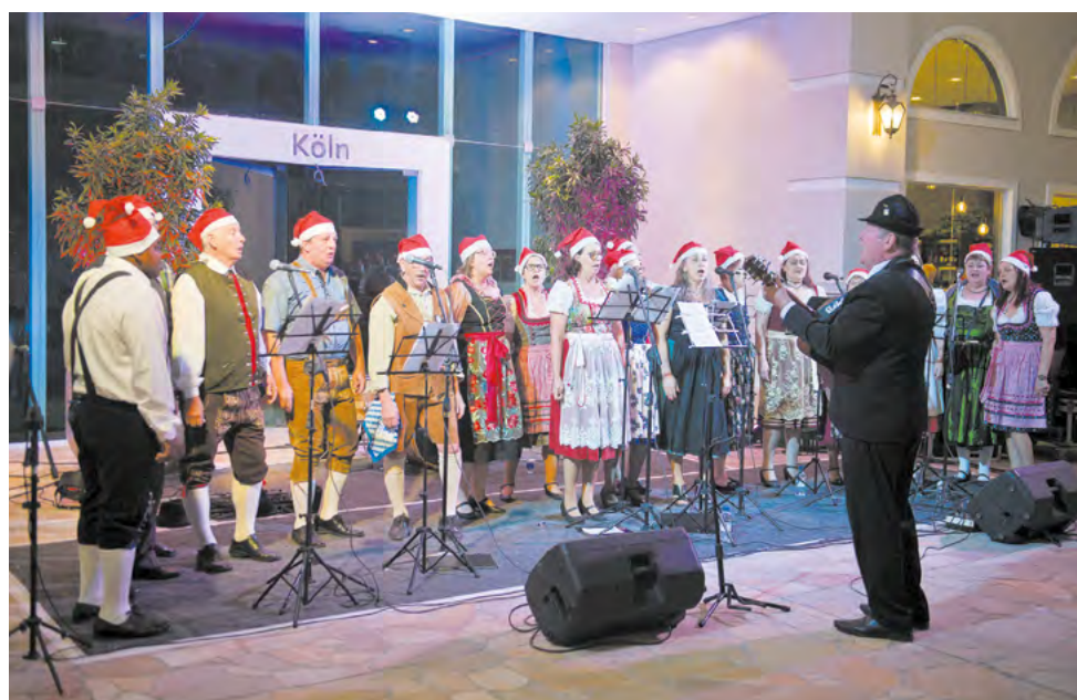
Coral do 25 de Julho brilhou na abertura