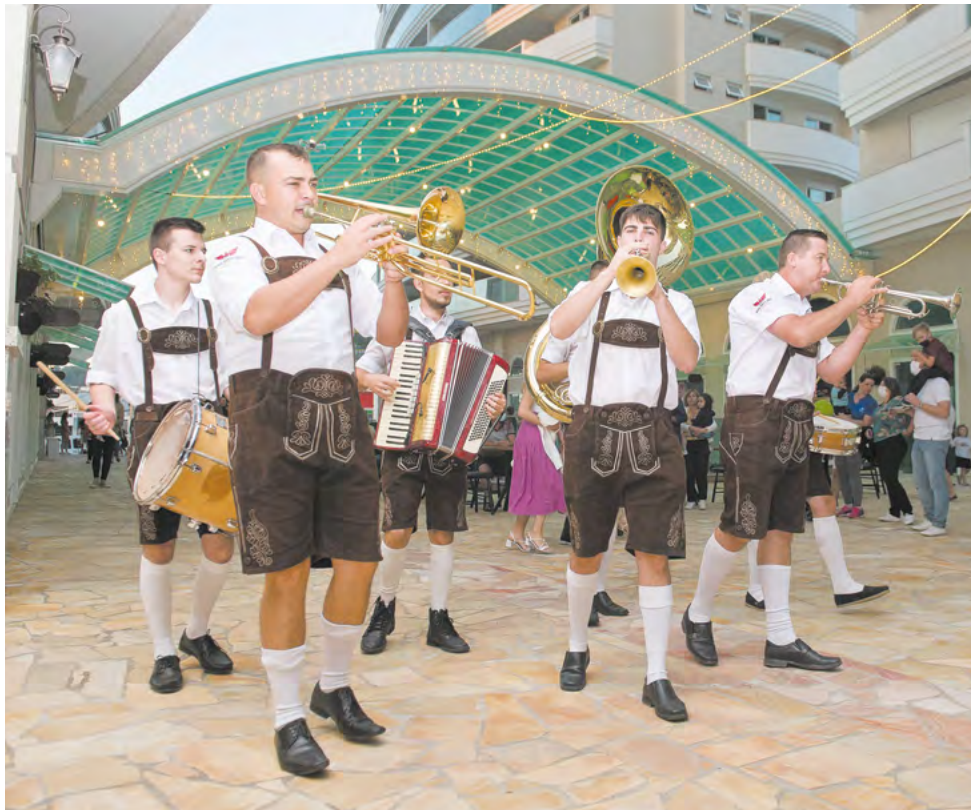
A Super Banda Santa Cruz esteve presente durante toda a programação