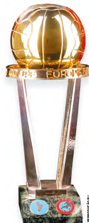
Copa Intercontinental foi disputada entre 1960 e 2004

Parece difícil definir a situação do título mundial do Grêmio. Mas o fato é que a Copa Intercontinental era o máximo que um clube podia alcançar no período em que ela foi disputada. Por isso, o Grêmio pode ser considerado campeão mundial, a meu ver.