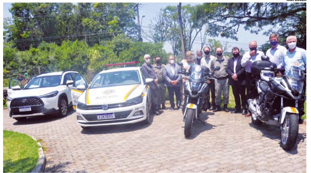
Viaturas foram entregues à BM nas dependências do Country Club

“O evento é uma troca de boas práticas e a demonstração das atividades realizadas. Em 2021 tivemos uma redução em torno de 35% dos crimes contra a vida, além da queda de 50% em roubo de veículos e a bancos, que tiveram redução de 90%. Tudo isto se deve à formação de uma base que é a integração, inteligência dos policiais e investimento qualificado, como o caso do recebimento das novas viaturas. A redução dos indicadores criminais no Vale do Rio Pardo é destaque no Estado, sendo a que mais diminuiu os índices”, comentou o comandante-geral Vanius Cesar Santarosa.