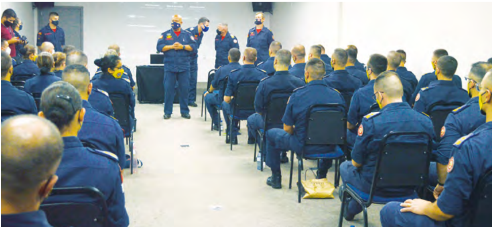
Batalhão local recebeu 53 alunos de todo o Estado no começo dessa semana