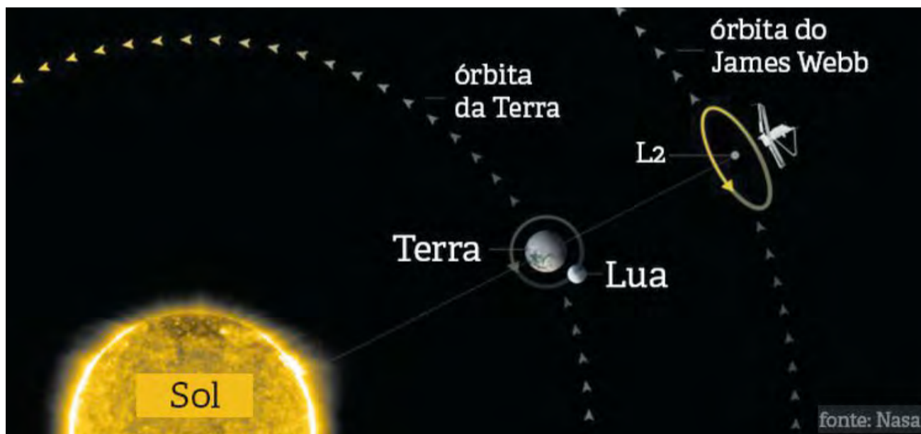
Infográfico mostra onde ficará o supertelescópio

Primeiro, o tamanho. Com um espelho de 6,5 metros, vai poder captar informações das primeiras galáxias que surgiram no universo, além de rastrear estrelas e novos