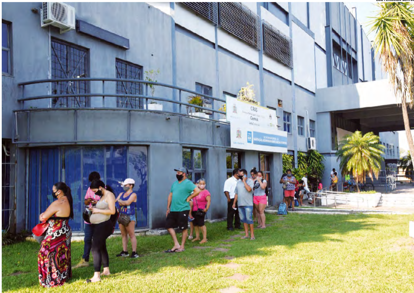
Inscrições começaram nessa quarta-feira e longas filas se formaram na Secretaria da Habitação

Para participar, o solicitante deve ter mais de 18 anos, possuir renda familiar mensal de até R$ 3,1 mil, apresentar capacidade de pagamento compatível com as despesas mensais de arrendamento, não ser proprietário de imóvel e nem possuir financiamento habitacional. Na inscrição, o requerente deverá portar documentos como CPF, RG e comprovante de renda. Outras informações podem ser obtidas na Secretaria Municipal da Habitação pelo telefone (51) 3715-1895 ou e-mail sehab@santacruz.rs.gov.br .