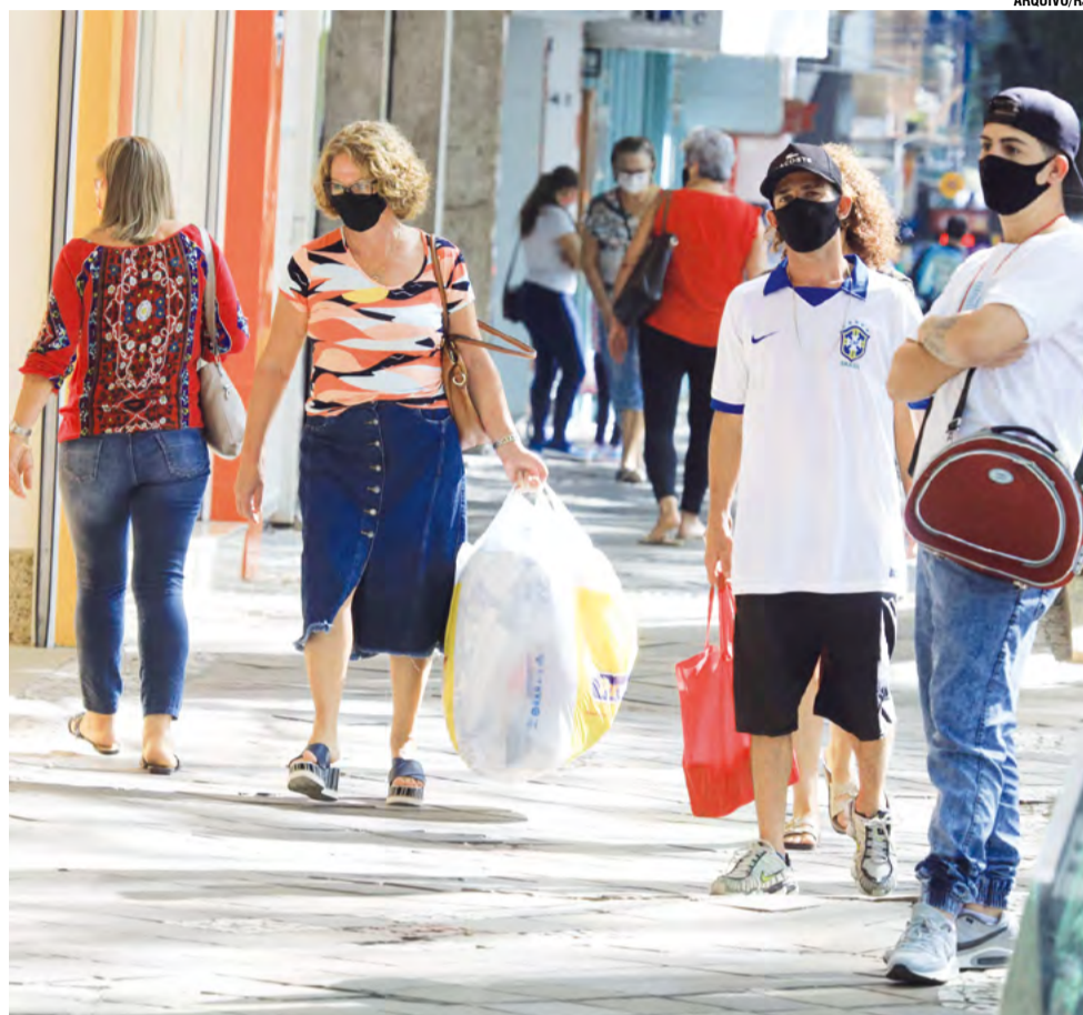
Na terça-feira, 25, foram registrados no sistema da Secretaria da Saúde (SES) 19 mil novos casos de Covid-19 e 50 óbitos pela doença no Estado

O aumento de casos no Rio Grande do Sul também ocorreu e segue acontecendo em diversos países, com máximas históricas. (Governo do RS)