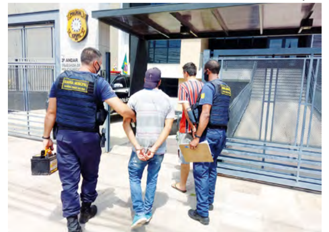
Suspeitos foram presos por agentes e conduzidos à Delegacia de Polícia