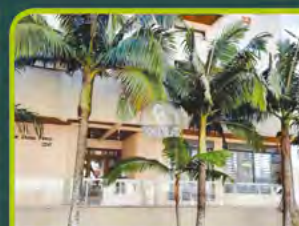
LOJA COMERCIAL UNIVERSITÁRIO

Loja com +-63m² e banheiro valor: R$ 1.400,00 + encargos L-SLC-015