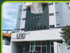
ED. UNIC SMART HOME

01 dorm, sala, cozinha/ área de serviço, sacada, banheiro e box. R$ 1.100,00 + encargos L-AP-316