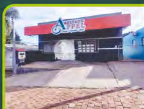
PRÉDIO COMERCIAL BONFIM

03 salas, 02 banheiros c/ 200m² valor: R$ 1.500,00 + encargos L-SLC-006