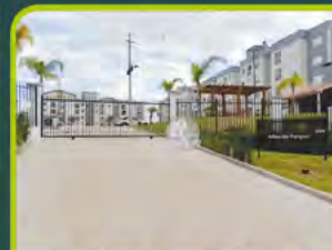
ED. RES. ALTOS DO PARQUE

03 dorm (01 suite), 02 banheiros, sala estar/ jantar, cozinha, área de serviço, churrasqueira, lareira, garagem p/ 02 carros. R$ 3.800,00 + encargos L-DP-026