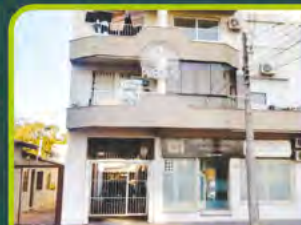
ED. ASSIS BRASIL

Dorm/ sala/ cozinha/ área de serviço, banheiro, sacada e box. R$ 650,00 + encargos L-AP-098