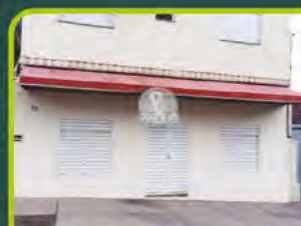
LOJA COMERCIAL SENAI

01 sala com 32m² e banheiro. Valor: R$ 1.000,00 + encargos L-SLC-105