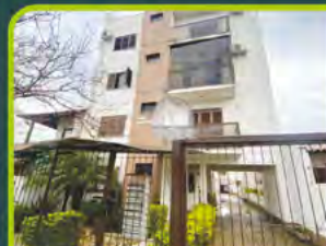
ED. RES. JOÃO PESSOA

(semimobiliado) 01 dorm, sala, cozinha/ área de serviço, banheiro, sacada, churrasqueira, elevador e box. Valor: R$ 1.950,00 + encargos L-AP-290