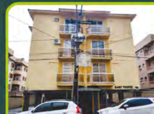
ED. SAINT TROPEZ (JK)

Dorm/ sala/ cozinha/ área de serviço, banheiro, sacada e box. R$ 650,00 + encargos L-AP-098