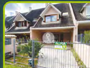
DUPLEX SEMIMOBILIADO S. INÁCIO

02 dorm, banheiro, sala de estar, cozinha, área de serviço, sacada e box. Valor: R$ 1.300,00 + encargos L-AP-238