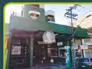
LOJA COMERCIAL ED. GREEN CENTER

02 dorm (01 suite), 02 banheiros, sala estar, cozinha/ área de serviço, churrasq e box. Valor: R$ 1.200,00 + encargos l-ap-321