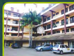
LOJA JARDINS DA FLORA

Loja com +-52m², 01 sala e banheiro. Valor: R$ 2.300,00 + encargos L-SLC-069