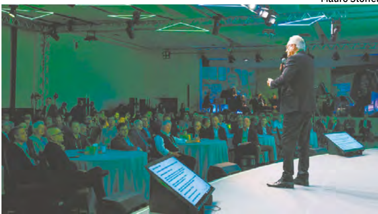
Forum Nacional de Presidentes e Diretores Executivos

evento. “A realização deste encontro tinha um foco claro: pessoas, cultura e planejamento estratégico. Foi uma oportunidade valiosa para trocarmos experiências, compartilhar boas práticas e aprender uns com os outros, enriquecendo a forma como nos preparamos para os desafios futuros. Também estivemos reunidos em Gramado não só para discutir o futuro, mas para demonstrar nosso apoio ao estado do Rio Grande do Sul, que ainda enfrenta as consequências das fortes chuvas de maio. Este é um momento de reconstrução, de solidariedade, e reforçamos nosso compromisso com a recuperação da economia local ao trazer o evento para cá”, afirmou. Além de discutir as prioridades para 2025, o Fórum contou ainda com palestras e debates sobre os avanços na estratégia sistêmica e resultados de 2024 nos segmentos PJ, PF e Agro. Dois palestrantes externos tam-