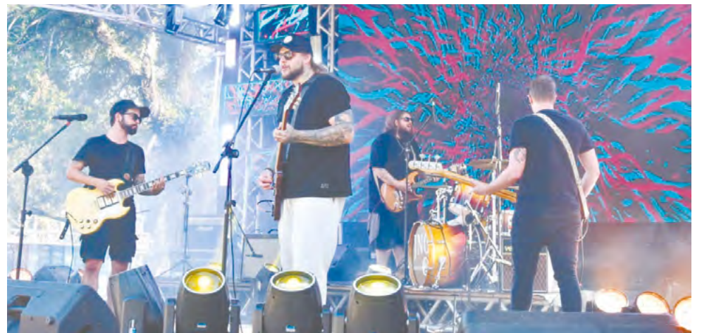
Shows artísticos e culturais marcaram os dois dias de evento