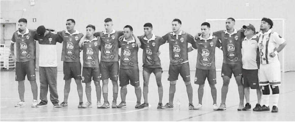
SER Faxinal chegou às semifinais