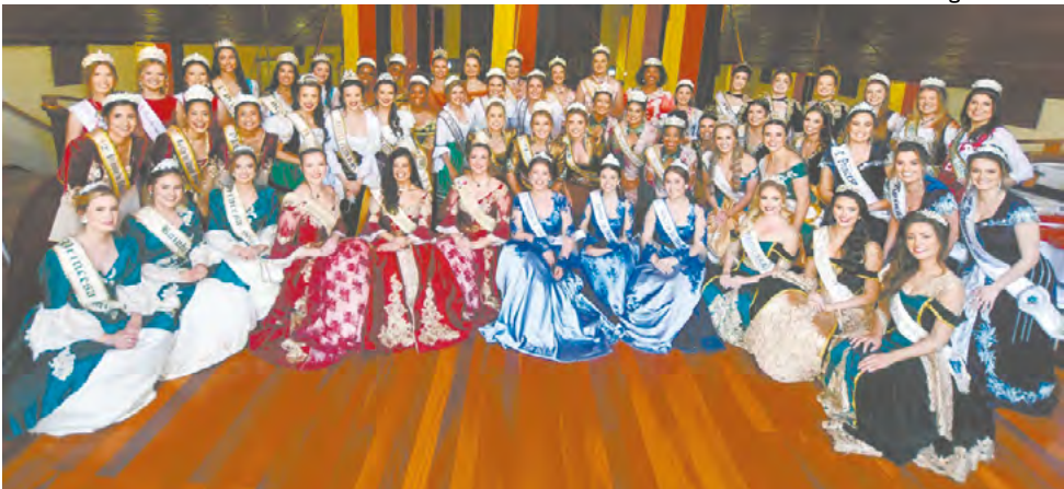
Encontro vai reunir soberanas dia 11 de outubro

Para a coordenadora de Recepção e Experiência dos Visitantes, Mônica Hippler, todas as atividades e inovações trarão um impacto positivo para a festa. "A Oktoberfest deste ano está ainda mais acolhedora. Pensamos em cada detalhe