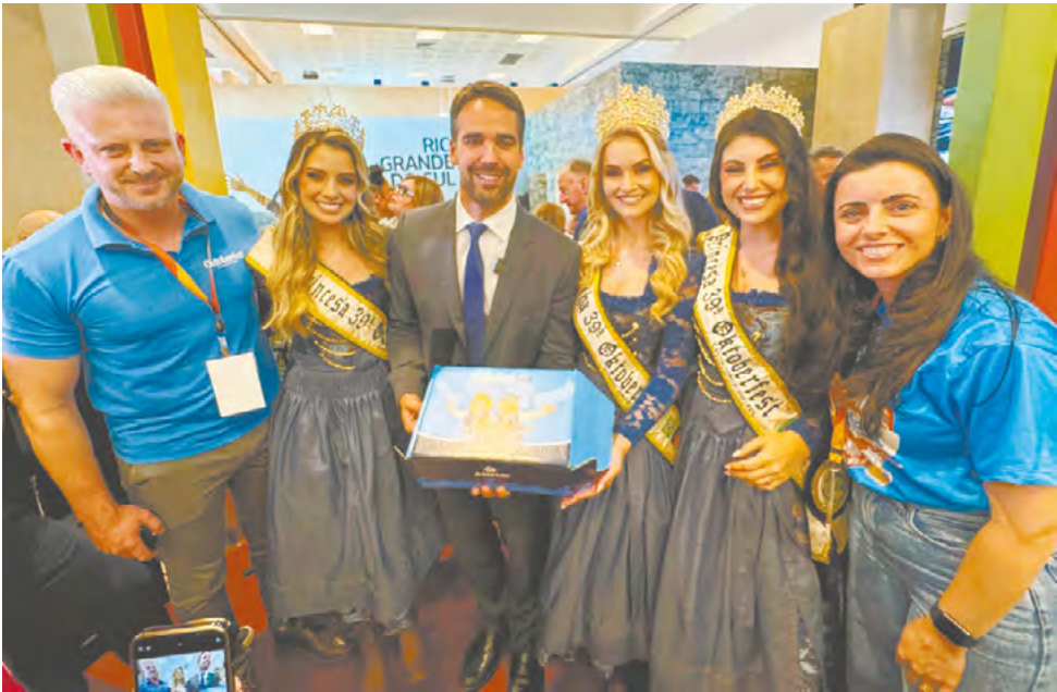
Comitiva da Oktoberfest na ABAV Expo

A 39ª Oktoberfest, que ocorre de 10 a 13, 17 a 20 e 24 a 27 de outubro, no Parque da Oktoberfest, em Santa