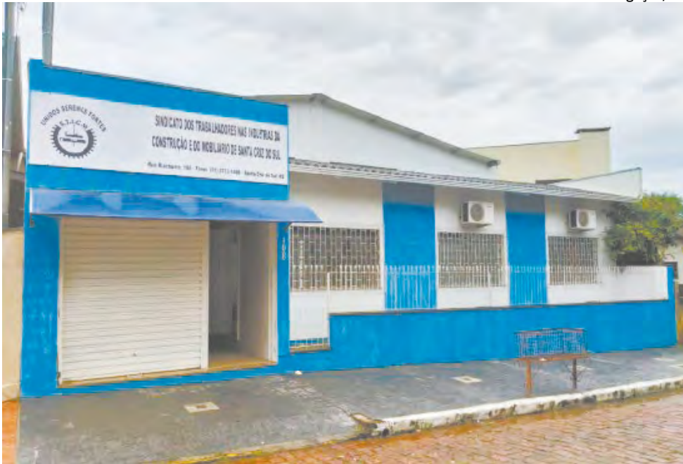
A antiga sede do sindicato, antes localizada na Rua Riachuelo, 108