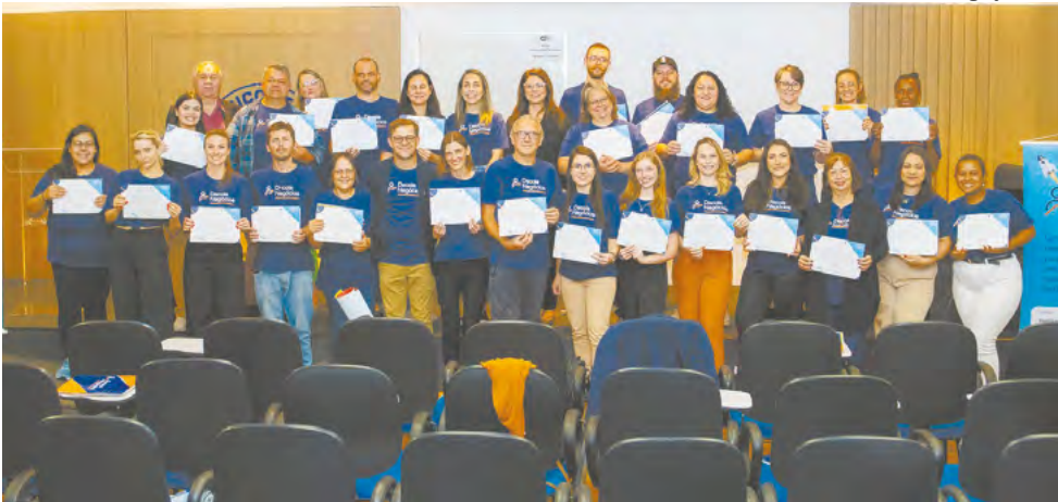
Programa com foco na formação de jovens do meio rural também foca na criação de empreendimentos e negócios no setor primário