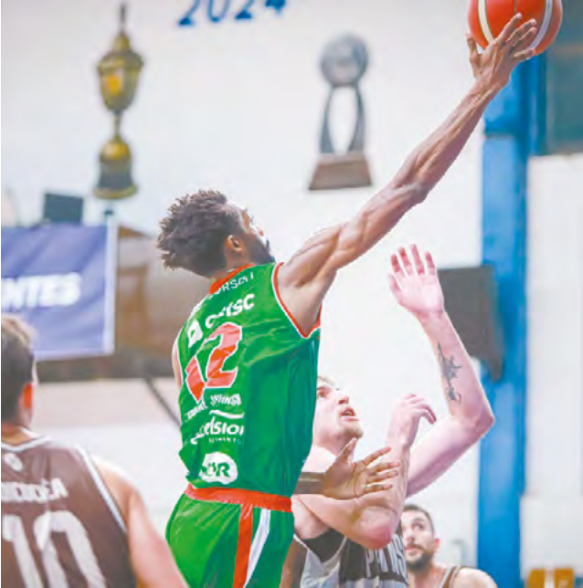
União Corinthians entra no mês de estreia no NBB 2024/25, quer será no dia 15, na Paraíba