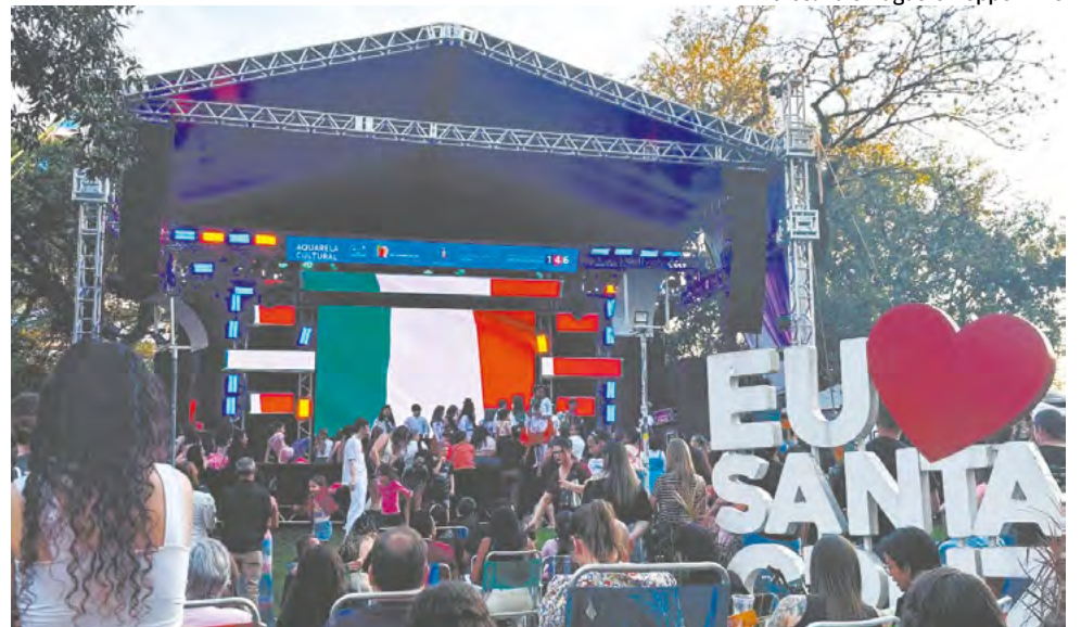
Diversos atrativos foram oferecidos para comemorar o dia do município