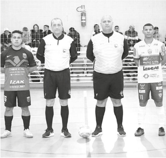
Finais estão marcados para hoje e sexta-feira

As finais da Copa Regional Miller/Sicredi/Ulfer/LKC de Futsal são nesta terça-feira, no CIE Faxinal, a partir das 19h30, em três categorias. No sub-20, Atlético dos Guris x Atlético de Vera Cruz; no lendas, Esperança/Galáticos x Progresso; e, no livre, KeB Milinários x Lord. Um encontro regional na categoria livre: Venâncio Aires x Vera Cruz. O jogo de volta está marcado para a próxima sexta-feira, 4. O Regional de Futsal tem o apoio da Prefeitura de Santa Cruz e Master Pizza; e patrocínio de Miller, Sicredi, Ulfer e LKC.