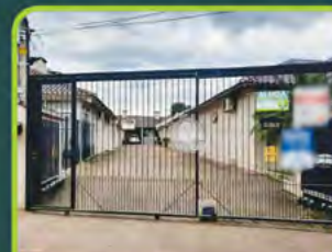
GEMINADO B. CASTELO BRANCO

03 dorm./ (01 suíte), 03 banheiros, sala de estar/jantar c/ lareira, cozinha, área de serviço, espaço gourmet, piscina e garagem. R$ 6.000,00 + encargos L-AL-096