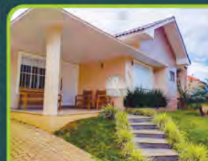
CASA BAIRRO COUNTRY

03 dorm./ (01 suíte), 02 banheiros, sala de estar/ jantar, cozinha, área de serviço, churrasq. banheiro, sacada e 02 boxes. Valor: R$ 3.000,00 + encargos L-AP-103