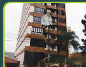
ED. PONTA VERDE (SEMIMOBILIADO)

03 dorm./ 02 banheiros, sala de estar/jantar, cozinha, área de serviço, churrasqueira, despensa, dep. Empregada, piscina e garagem. Valor: R$ 3.500,00 + encargos L-AL-095