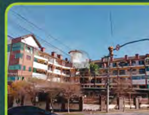
SALA COM. RES. JARDIM DA FLORA

Loja com +/- 48,08m 2 , banheiro. Valor: R$ 2.900,00 + encargos L-SLC-040