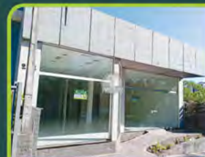
LOJA COMERCIAL CENTRO

Loja com 383m 2 , 02 salas, 03 banheiros, mezanino e depósito. Valor: R$ 12.000,00 + encargos L-SLC-112