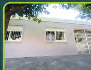
CASA RESIDENCIAL B. GOIÁS

03 dorm./ sala, cozinha, área de serviço, 02 banheiros, dep. Empregada, churrasqueira, elevador, sacada e box. Valor: R$ 2.300,00 + encargos L-AP-142