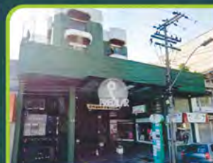
ED. GREEN CENTER

Dorm./ sala/ cozinha/ área de serviço, banheiro. R$ 1.390,00 + encargos L-AP-327