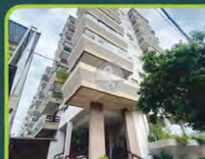
ED. SÃO LUCAS

(semimobiliado) 01 dorm./ sala/ cozinha/ área de serviço, sacada e banheiro. R$ 1.000,00 + encargos L-AP-249