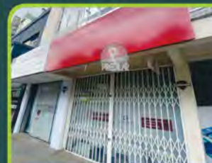
LOJA COM. L. RUA V. AIRES N°525

Loja com 197m 2 e 02 banheiros. Valor: R$ 5.500,00 + encargos L-SLC-111