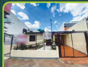
CASA COMERCIAL CENTRO

01 dorm./ sala, cozinha, área de serviço, churrasqueira e vaga de estacionamento. Valor: R$ 800,00 + encargos L-AL-076