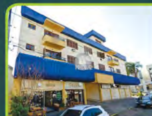
ED. NEW YORK (JK SEMIMOBILIADO)

Dorm./ sala/ cozinha/ área de serviço, banheiro. R$ 1.390,00 + encargos L-AP-327