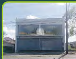
LOJA COMERCIAL BAIRRO GOIÁS

06 salas, 02 banheiros, cozinha, acessibilidade pne, pátio e garagem. Com 202m 2 Valor: R$ 3.400,00 + encargos L-AL-085