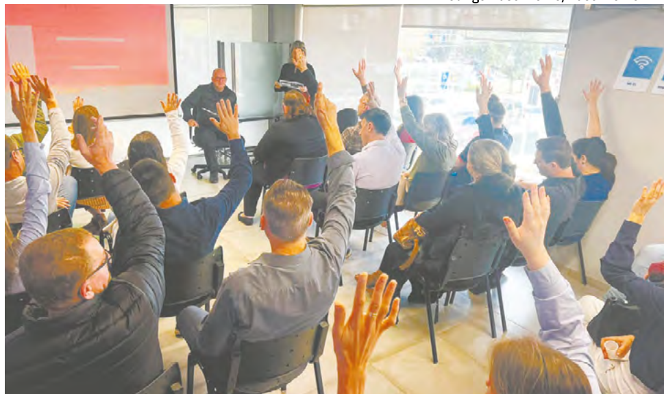
Coletivo decidiu pela manutenção do acordo coletivo para o trabalho aos domingos durante a Oktoberfest

Além do acordo coletivo para a Oktoberfest e o dissídio coletivo, a assembleia também modificou a proposta de calendário especial de fim de ano, alterando o horário de um dia