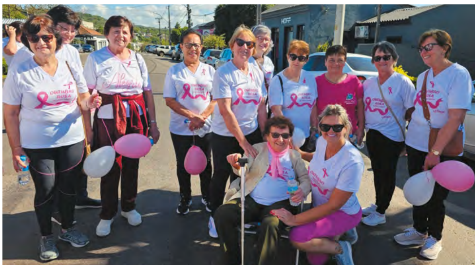
Participantes da caminhada