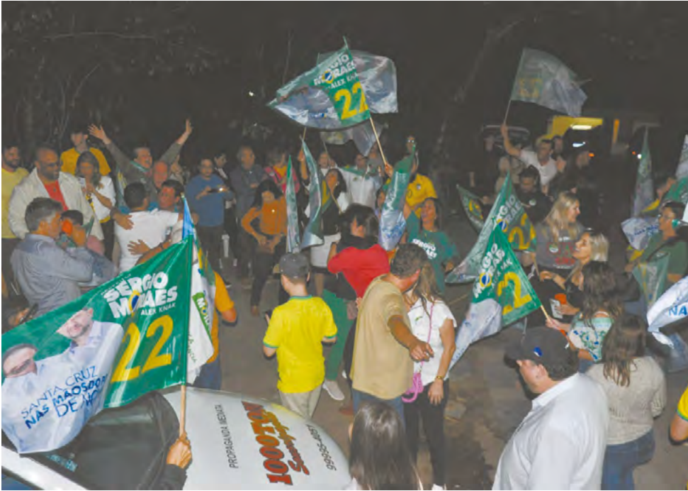
Festa no QG no final da votação