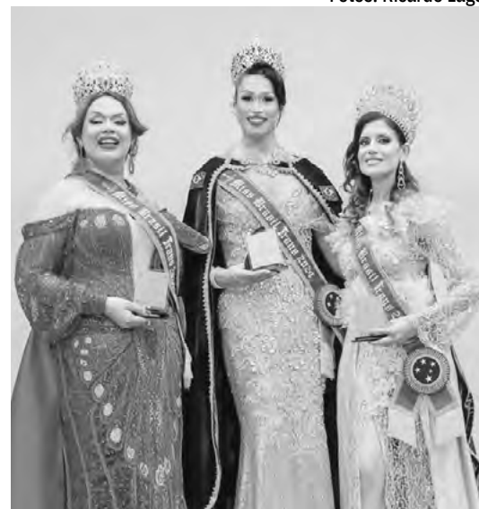
Trio vai representar o Brasil na Índia