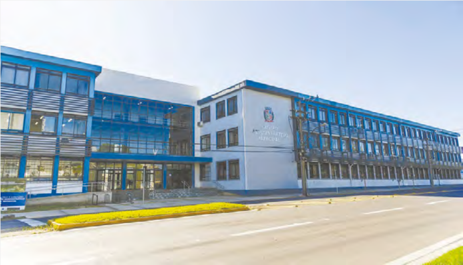
Atendimento será temporariamente transferido para o Centro Administrativo I, localizado na Rua Coronel Oscar Jost, 1551

Em razão da movimentação gerada pela 39ª Oktoberfest, a partir da próxima terça-feira, 8 de outubro, o atendimento da Secretaria Municipal de Meio Ambiente, Saneamento e Sustentabilidade (Semass) será temporariamente transferido para o Centro Administrativo I, localizado na Rua Coronel Oscar Jost, 1551. Até o término da Festa da Alegria, o público será atendido no 1º andar do Centro Administrativo, junto à Secretaria Municipal da Fazenda. O