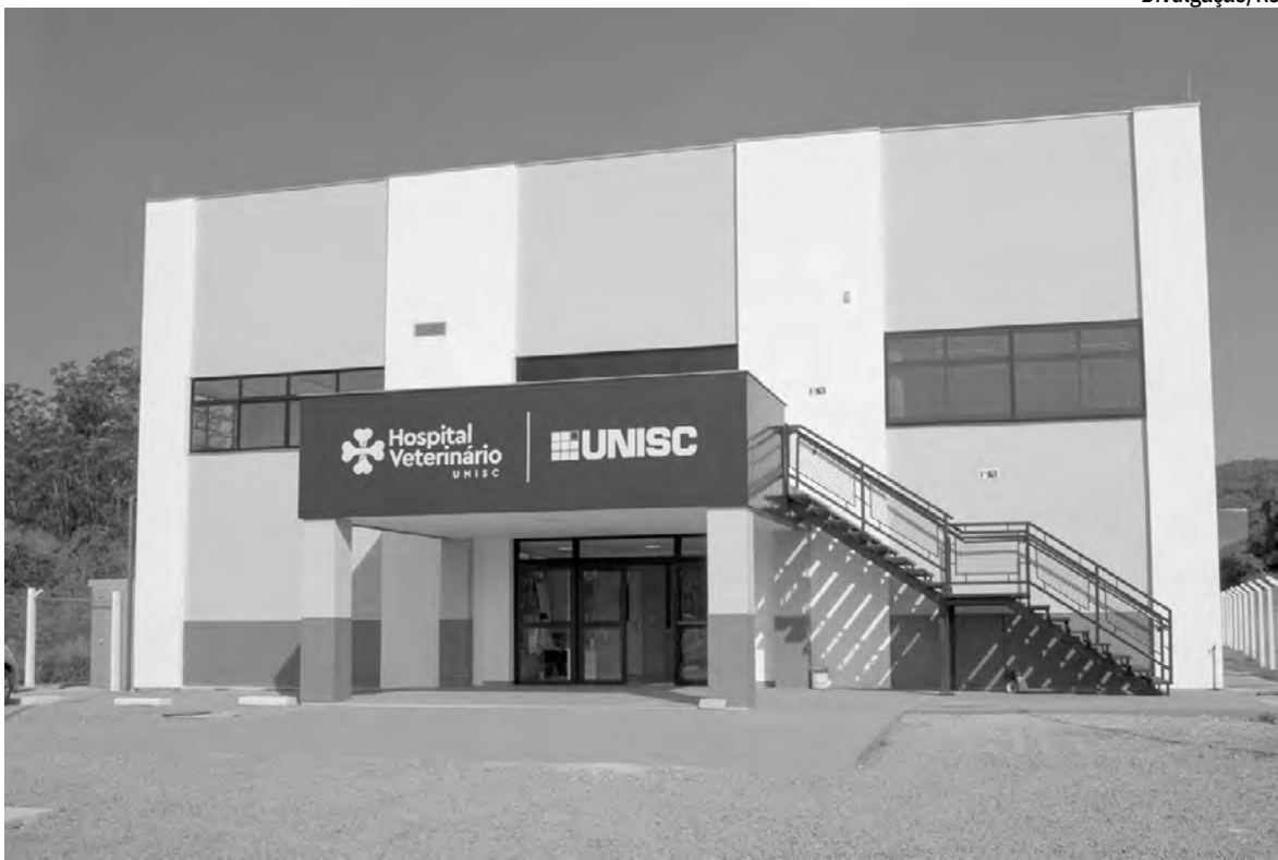
Hospital Veterinário está localizado às margens da RSC-287, em Linha Pinheiral

atende no formato particular para animais de pequeno porte, grande porte e também os chamados pets não-convencionais (hamsters, coelhos, porquinhos-da-índia, aves, etc). Segue expandindo os serviços de exames laboratoriais e as atuações entre diversas áreas de especialidades veterinárias, entre elas, gastroenterologia, endocrinologia e nefrologia. Ortopedia, neurologia, oftalmologia, oncologia e dermatologia seguem sendo as especialidades mais procuradas pelos tutores. O HV também tem o manejo “cat friendly”, ou seja, amigável para felinos, e que tem como objetivo a melhoria do atendimento à espécie felina, envolvendo todos os aspectos que compõem o seu manejo (contenção, tratamento, procedimentos) até a própria estrutura e ambientação do hospital (consultório exclusivo e áreas de ambientação individualizados para a espécie). A partir da qualificação do atendimento, com estratégias para a redução do estresse, há maior assertividade na avaliação médica de felinos e, consequentemente, a confiança e segurança dos tutores com relação ao que está sendo feito pelos seus pets. Recentemente, houve a 2ª edição do Curso de Manejo em Felinos, realizado nas dependências do HV, com público-alvo alunos e egressos do curso de Medicina Veterinária, bem como profissionais da região.