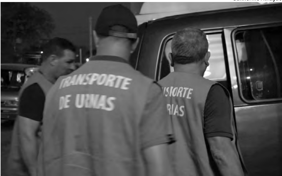
Urnas de toda Região foram contabilizadas no Cartório Eleitoral, em Santa Cruz do Sul