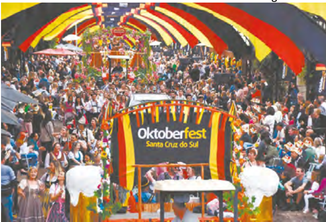
Festa da Alegria inicia nesta quinta-feira, dia 10, a partir das 17h

Entre eles os atrativos os shows nacionais com Lauana Prado, dia 11; Traia Vêia e Alok, dia 12; Bruno e Marrone e Corpo