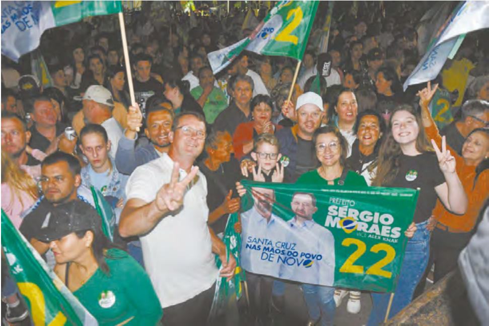
A vitória foi comemorada junto com a população em frente ao Parque da Oktoberfest