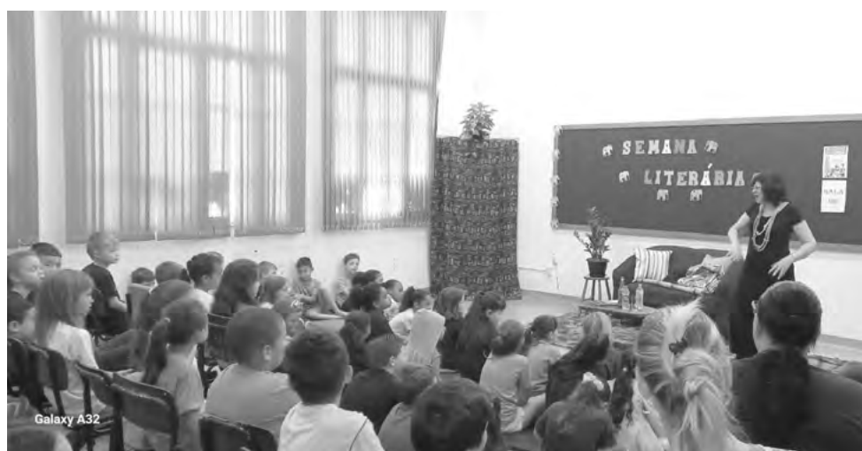
Programação contou com palestras, oficinas e contação de histórias