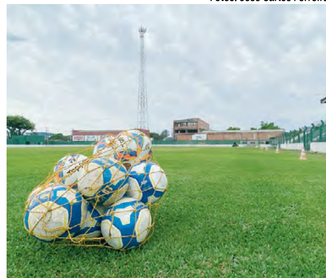
Gramado foi trocado e outras instalações recebem intervenções

ham na reestruturação das casamatas das equipes, um pedido da FGF