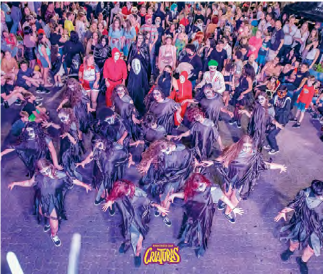
Jef's Studio de Dança fez a abertura da procissão com a coreografia Thriller