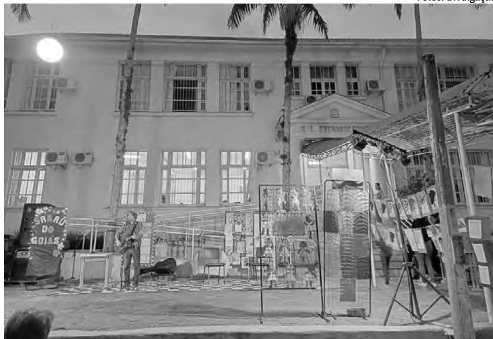
Trabalhos dos alunos formaram exposição pela Escola