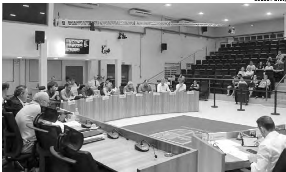
Sessão da Câmara desta segunda foi novamente marcada por críticas à Corsan/Aegea, devido ao persistente gosto e cheiro da água no município