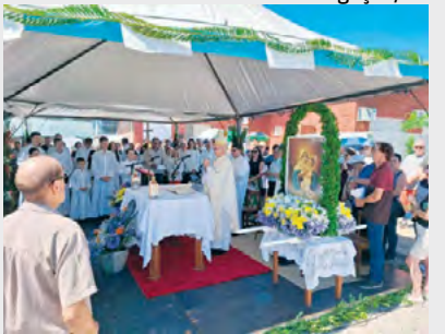
Fé e devoção marcou mais uma edição da romaria

Às 9h30min foi celebrada uma missa campal no santuário. Ao final, a coroação da Mãe de Deus, pelos 75 anos de caminhada. A imagem ficará disposta, em um painel de 5 metros