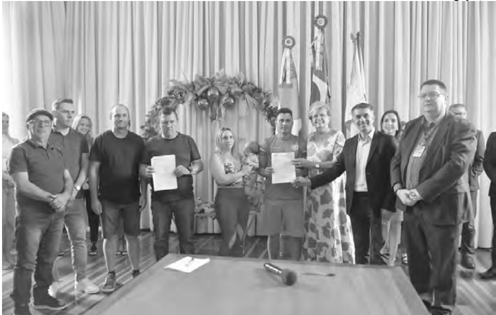
Ato teve presença do Secretário Nacional da Reconstrução do RS, Maneco Hassen, e de representantes do bairro Várzea

A segunda proposta, no valor de R$ 5 milhões, é destinada à melhoria da