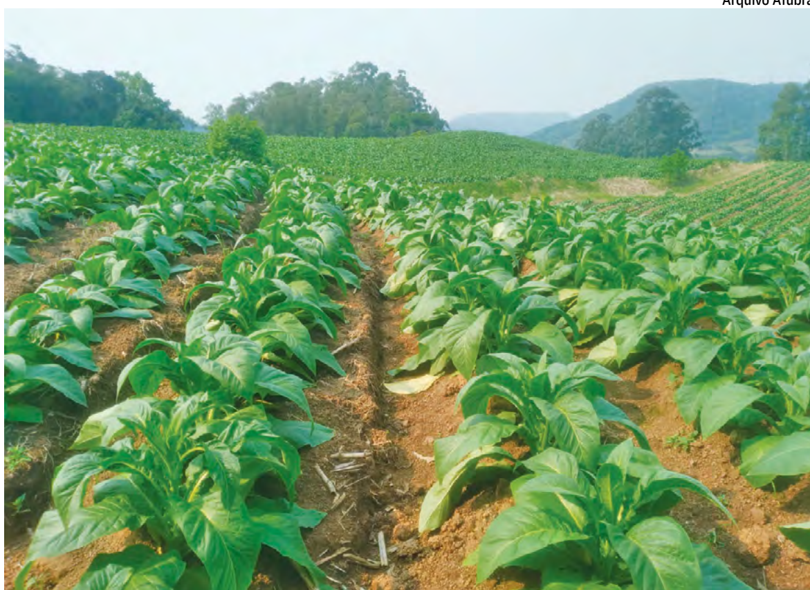
Em termos de volume de produção, a estimativa inicial aponta para um incremento de 37,08%, o que resultaria em 696.435 toneladas produzidas no Sul do Brasil

O presidente da Afubra enfatiza que esta é uma estima-