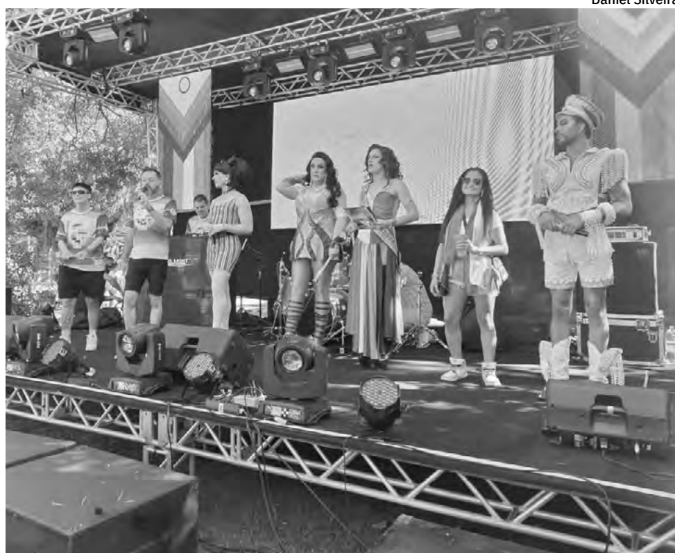
Atividade já se consolidou como a maior parada dos Vales do Rio Pardo e Taquari

A 4ª Parada da Diversidade foi organizada