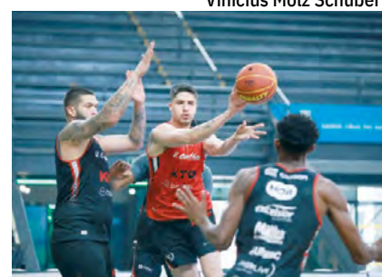
Time de Santa Cruz encara o Mogi das Cruzes amanhã e o São José na sexta