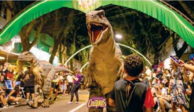
Sucesso na 9ª edição a procissão trouxe dois dinossauros para este ano