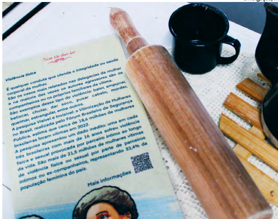
Ação mobiliza para a Campanha 21 Dias de Ativismo pelo fim do Racismo e da Violência contra mulheres

No Brasil, a campanha ocorre desde 2003 e é chamada de 21 Dias de Ativismo, porque começa no dia 20 de novembro, Dia da Consciência Negra. A mobilização termina em 10 de dezembro, Dia Internacional dos Direitos Humanos.