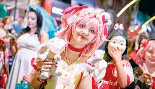
A criatividade na caracterização foi o ponto alto do desfile