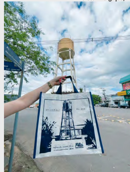
Caixa D'Água de Vera Cruz, também serviu de ilustração

O Miller Supermercados tem o orgulho de apresentar sua nova coleção de sacolas retornáveis “Valores da Nossa Terra”, que traz estampados três pontos turísticos de nossa região: a Catedral São João Batista e o Parque da Gruta, de Santa Cruz do Sul, e a Caixa D'Água de Vera Cruz. As ilustrações, desenhadas pelo artista santa-cruzense Pepe Fontanari, valorizam a identidade e a cultura local, trazendo mais proximidade e beleza ao cotidiano de nossos clientes.