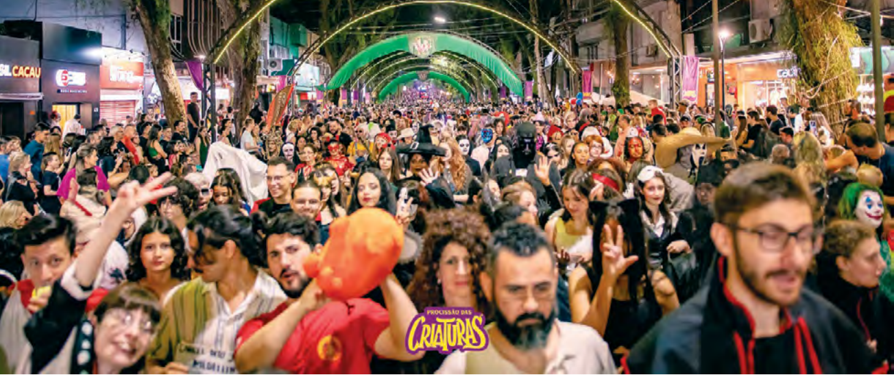
Floriano lotada com a presença dos participantes