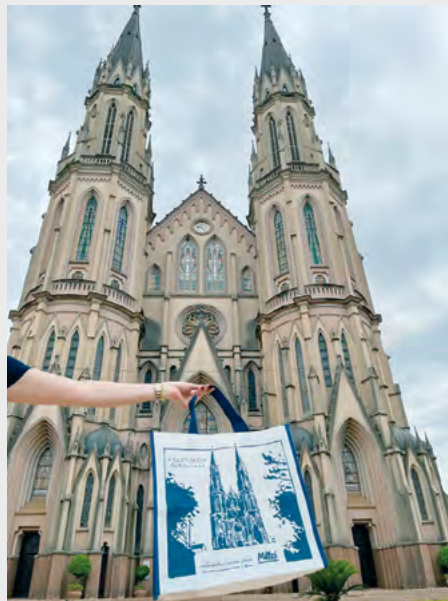
Catedral São João Batista está retratada nas sacolas