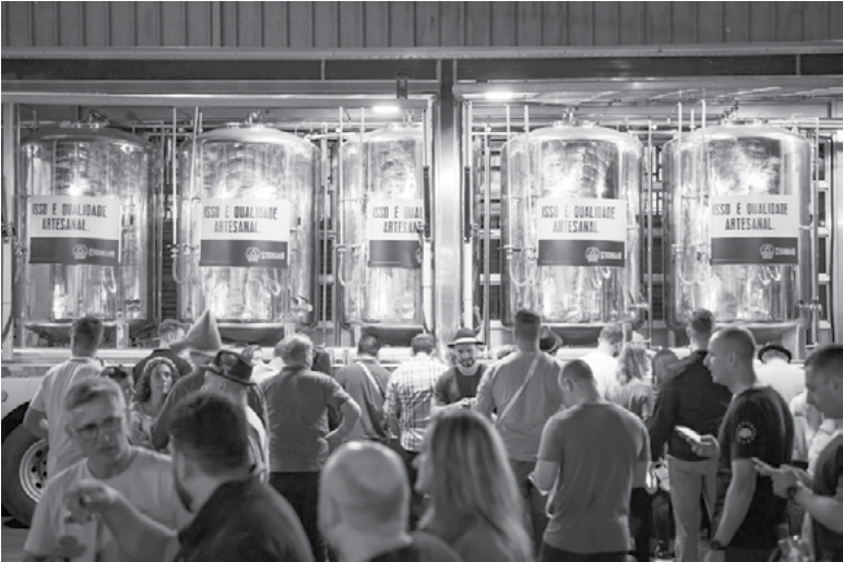
Consumo de chope foi o maior registrado