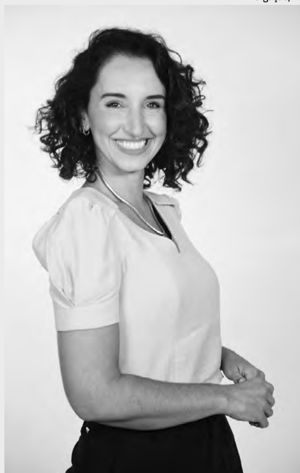
Jornalista vai contar sua trajetória de vida e superação no auditório da Assemp a partir das 19h