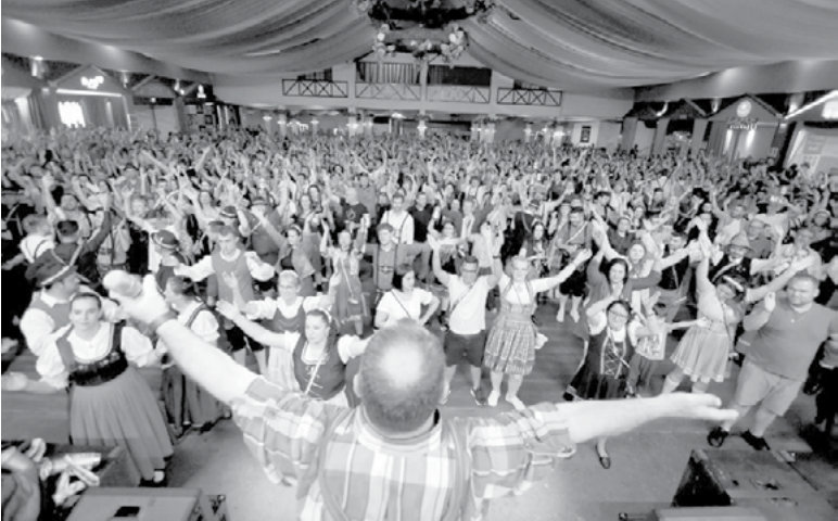
Público pagante, que considera os acessos de ingressos e permanentes ao parque, shows nacionais e bailes do Pavilhão Central, chegou a 120.219 pessoas