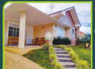
CASA BAIRRO COUNTRY

03 dorm (01 suite), 02 banheiros, sala de estar/ jantar, cozinha, área de serviço, churrasq, banheiro, sacada e 02 boxes. Valor: R$ 3.000,00 + encargos L-AP-103