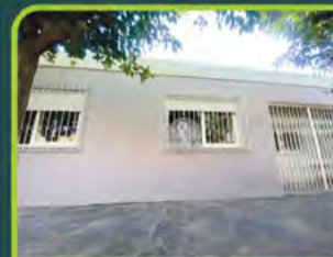
CASA RESIDENCIAL B. GOIÁS

03 dorm, sala, cozinha, área de serviço, 02 banheiros, dep. Empregada, churrasqueira, elevador, sacada e box. Valor: R$ 2.300,00 + encargos L-AP-142