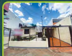
CASA COMERCIAL CENTRO

01 dorm, sala, cozinha, área de serviço, churrasqueira e vaga de estacionamento. Valor: R$ 800,00 + encargos L-AL-076