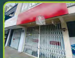
LOJA COML. RUA V. AIRES N°525

Loja com 197m 2 e 02 banheiros. Valor: R$ 5.500,00 + encargos L-SLC-111