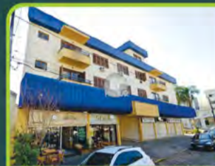
ED. NEW YORK (JK SEMIMOBILIADO)

Dorm/ sala/ cozinha/ área de serviço, banheiro. R$ 1.390,00 + encargos L-AP-327