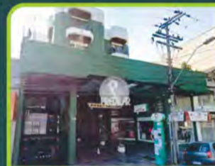
ED. GREEN CENTER

Dorm/ sala/ cozinha/ área de serviço, banheiro. R$ 1.390,00 + encargos L-AP-327