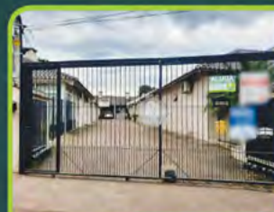
GEMINADO B. CASTELO BRANCO

03 dorm, (01 suite), 03 banheiros, sala de estar/jantar c/ lareira, cozinha, área de serviço, espaço gourmet, piscina e garagem. R$ 6.000,00 + encargos L-AL-096