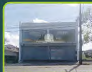
LOJA COMERCIAL BAIRRO GOIÁS

06 salas, 02 banheiros, cozinha, acessibilidade pne, pátio e garagem. Com 202m 2 Valor: R$ 3.400,00 + encargos L-AL-085