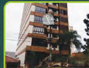
ED. PONTA VERDE (SEMIMOBILIADO)

03 dorm, 02 banheiros, sala de estar/jantar, cozinha, área de serviço, churrasqueira, despensa, dep. Empregada, piscina e garagem. Valor: R$ 3.500,00 + encargos L-AL-095