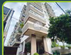
ED. SÃO LUCAS

(semimobiliado) 01 dorm, sala/cozinha/ área de serviço, sacada e banheiro. R$ 1.000,00 + encargos L-AP-249