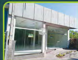
LOJA COMERCIAL CENTRO

Loja com 383m 2 , 02 salas, 03 banheiros, mezanino e depósito. Valor: R$ 12.000,00 + encargos L-SLC-112