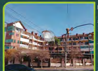
SALA COML. RES JARDIM DA FLORA

Loja com +/-43,08m 2 , banheiro. Valor: R$ 2.900,00 + encargos L-SLC-040