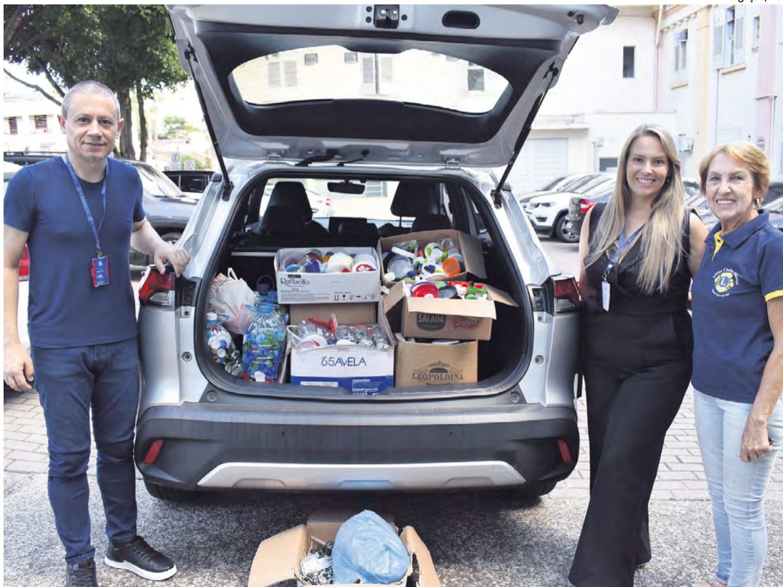
Projeto Bem na Tampa incentiva reciclagem e apoio à saúde