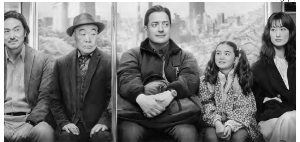
Drama japonês-americano aborda conexões humanas

O Cine Clube Amigos do Cinema de Santa Cruz do Sul apresenta hoje, às 19h30, o filme “Família de Aluguel” (“Rental Family”), dirigido por Hikari e lançado em 2025. A produção Japão/EUA, com 1h50 de duração, acompanha a trajetória de Phillip (Brendan Fraser), um ator americano que, perdido em Tóquio, encontra trabalho em uma agência de “famílias de aluguel”, onde atores interpretam entes queri-