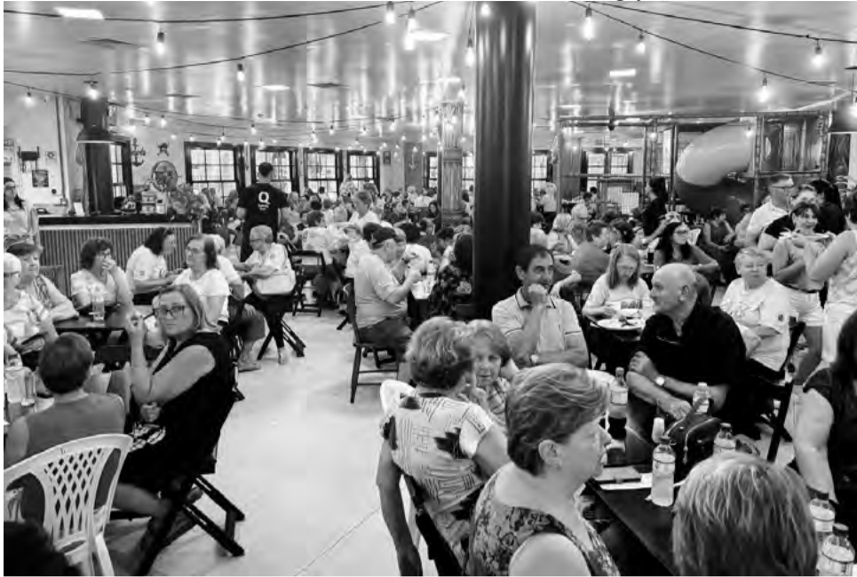
Evento reuniu 400 participantes em confraternização

O Conselho Municipal dos Direitos da Pessoa Idosa promoveu, um almoço de confraternização para marcar a celebração da Páscoa, reunindo mais de 20 grupos da terceira idade nas dependências do Quiosque da Praça, no Centro de Santa Cruz do Sul. O encontro contou com a participação de cerca de 400 pessoas de diferentes bairros e do interior, em uma programação que incluiu apresentação cultural, bênção ecumênica e almoço custeado pelo Fundo Municipal dos Direitos da Pessoa Idosa.