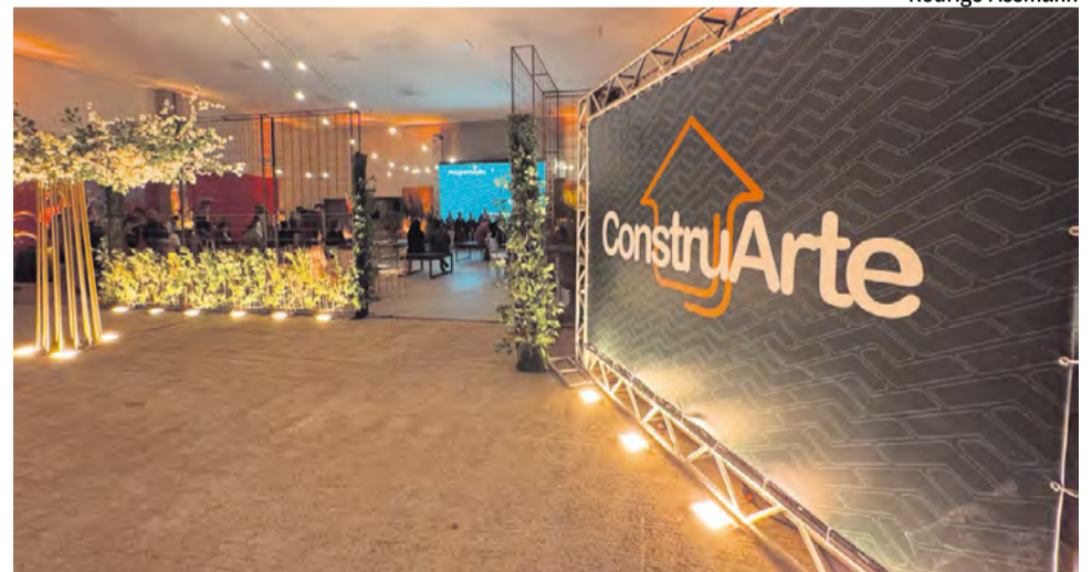
Evento reunirá construção, arquitetura e decoração em maio

Consolidada como a principal feira de construção da região, a mostra reúne empresas e profissionais dos setores de construção, arquitetura, decoração e comércio em geral. A programação ocorrerá de 14 a 17 de maio, no Parque da Oktoberfest, com entrada gratuita.