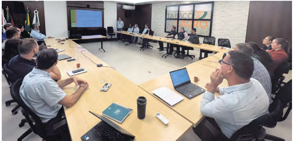
Reunião de apresentação dos resultados do primeiro ano do projeto