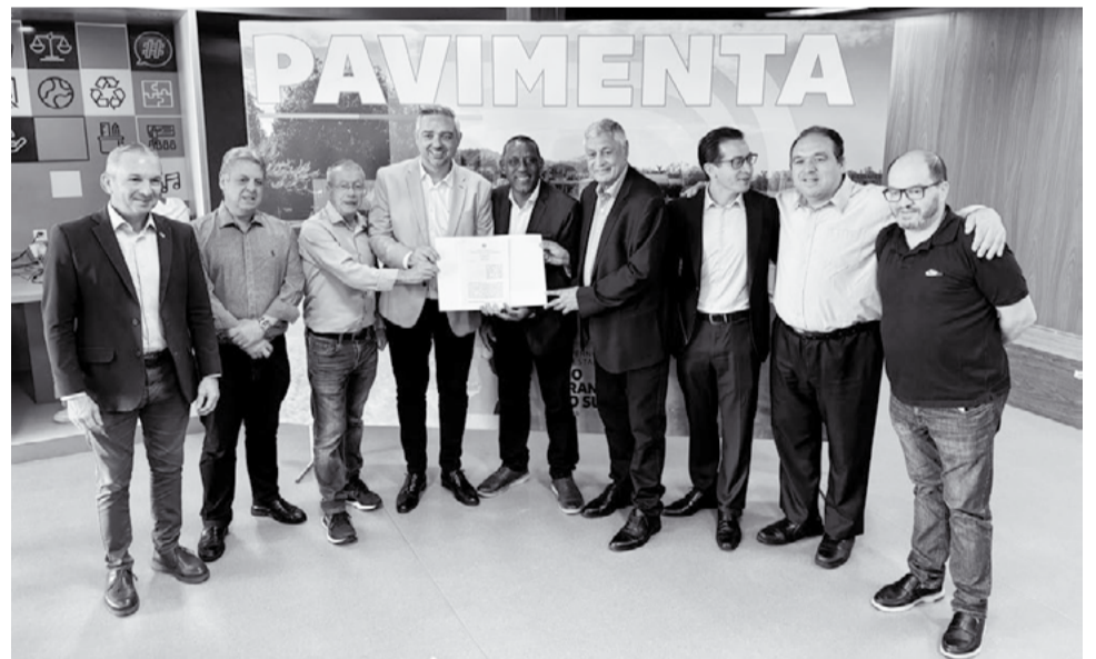
Investimento do Pavimenta 3 beneficiará comunidades rurais

O município de Vale do Sol oficializou, na quarta-feira, 1º, a adesão ao programa Pavimenta 3, iniciativa do governo do Estado voltada à melhoria da infraestrutura viária urbana e rural. Com a assinatura, o município foi contemplado com R$ 1 milhão, valor que será destinado à execução de pavimentação asfáltica nas localidades de Faxinal de Dentro e Linha Trombudo. A contrapartida municipal será de R$ 300 mil.