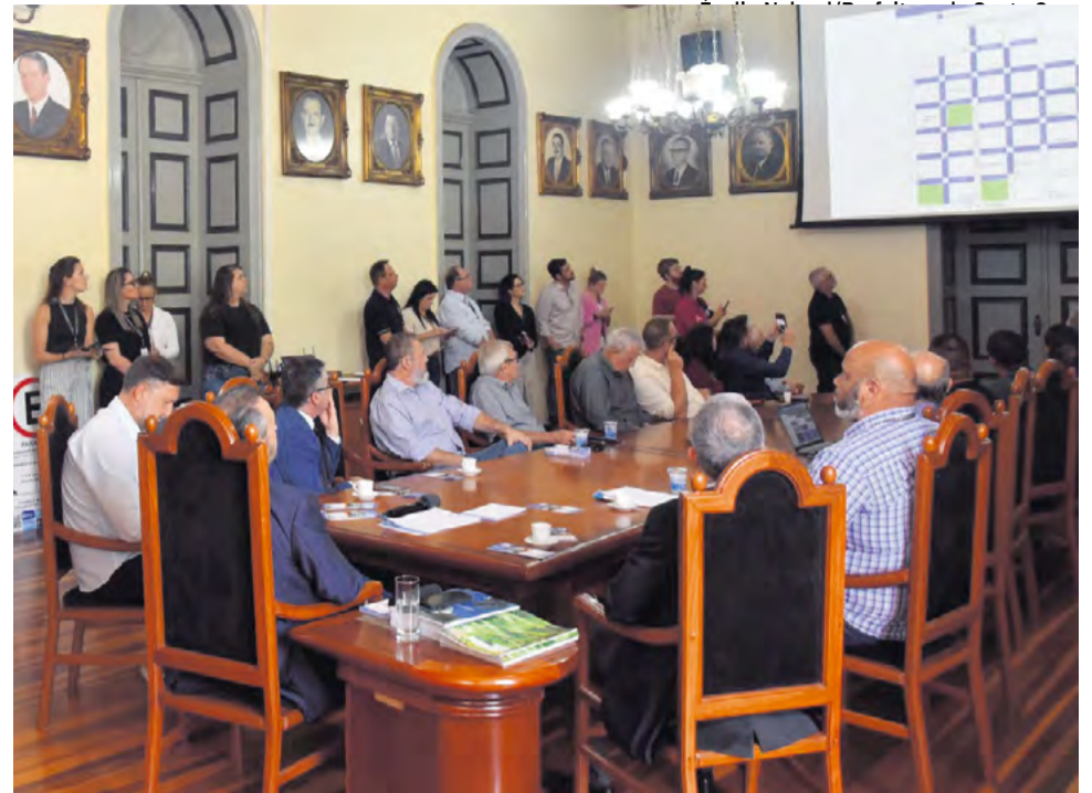
Novidades foram apresentadas na manhã de ontem na sede do governo municipal