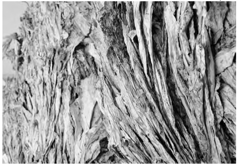
Qualidade do produto entregue e critérios de classificação estão entre os itens a serem observados

Drescher destacou ainda a importância da união entre entidades patronais e de trabalhadores rurais. “A mobilização conjunta evidencia a preocupação do setor com a condução da safra 2025/26 e com a necessidade de assegurar justiça, equilíbrio e respeito às regras estabelecidas no momento da comercialização”, concluiu.