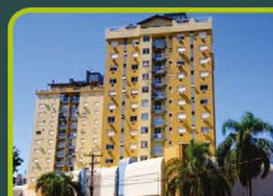
ED. MARCO DO IMIGRANTE

Dormitório/cozinha/área de serviço, banheiro e sacada. Valor: R$ 440,00 + ENCARGOS L-AP-078