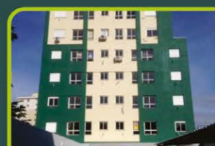
RES. VISTA LESTE

02 dormitórios, banheiro, sala de estar/jantar, cozinha, área de serviço, sacada c/churrasq. E box. Valor: R$ 1.200,00 + ENCARGOS L-AP-067