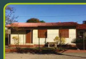
CHALÉ - SANTO ANTÔNIO

03 dormitórios, banheiro, sala de estar, cozinha/área de serviço, sacada fechada c/churrasq. E box. Valor: R$ 980,00 + ENCARGOS L-AP-074