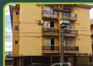
ED. SAINT TROPEZ (JK)

Dormitório/cozinha/área de serviço e banheiro. Valor: R$ 550,00 + ENCARGOS L-AP-068