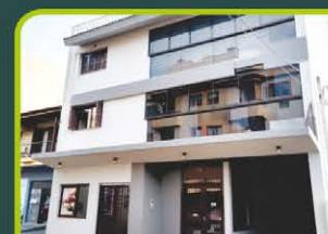
RES. DO VALE (JK)

Dormitório/cozinha/área de serviço e banheiro. Valor: R$ 550,00 + ENCARGOS L-AP-068