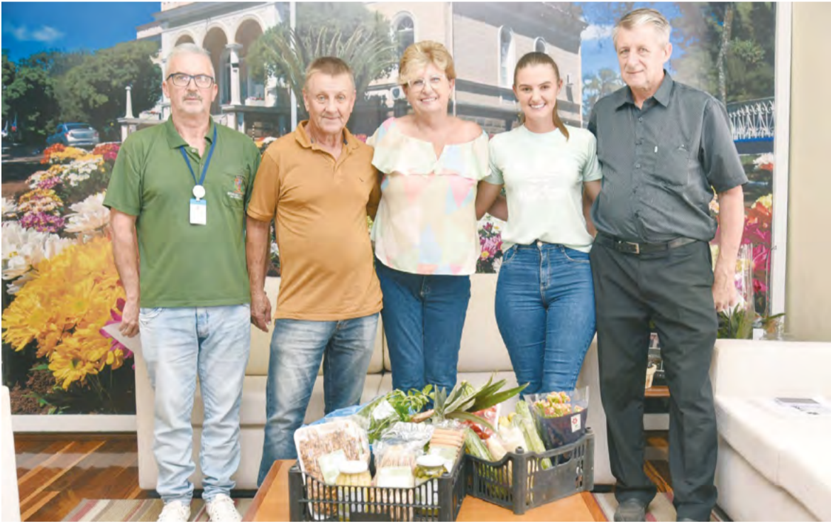
Grupo agradeceu o apoio do Executivo Municipal, como na reforma feita no prédio da Feira Central