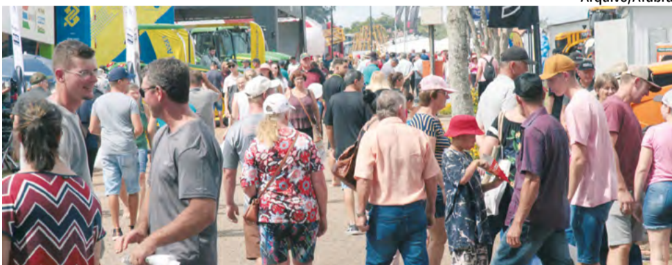
Conforme a coordenação da feira agropecuária, os visitantes têm acesso gratuito ao parque e às diversas atrações do evento

O público da Expoagro Afubra 2024 terá a opção de usar o transporte de ônibus da Viação União Santa Cruz para ir até o Parque de Exposições, localizado em Rincão del Rey, Rio Pardo. Serão sete opções de ida (das 7h30 às 14h45) e sete de volta (das 11h10 às 18h10), ao preço de R$ 9,00 por trecho. Em Santa Cruz do Sul, o local de partida será a Praça Siegfried Heuser, na Rua Júlio de Castilhos, Centro, próximo da pista de skate. Para o retorno da feira, a saída será ao lado do pórtico principal.