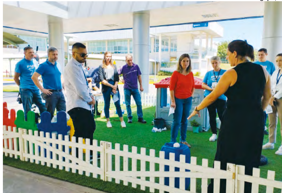
Quintal da Dengue é levado à empresas, escolas e entidades para conscientização

Atitudes de prevenção à proliferação do Aedes, como a limpeza e revisão das áreas interna e externa das residências e a eliminação dos objetos com água parada são ações que podem cortar o ciclo de vida das larvas do mosquito. Santa Cruz