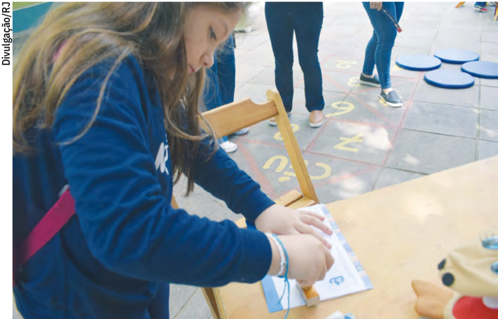
Edição 2023: Estudantes se divertiram com a ideia de carimbar o Diário de Bordo a cada visita

O quê? Open School Quando? Dia 16 de março Que horas? Das 9h às 11h Onde? Colégio Marista São Luís Público: Famílias maristas Reserve a data: 31 de agosto – Open School para a comunidade geral