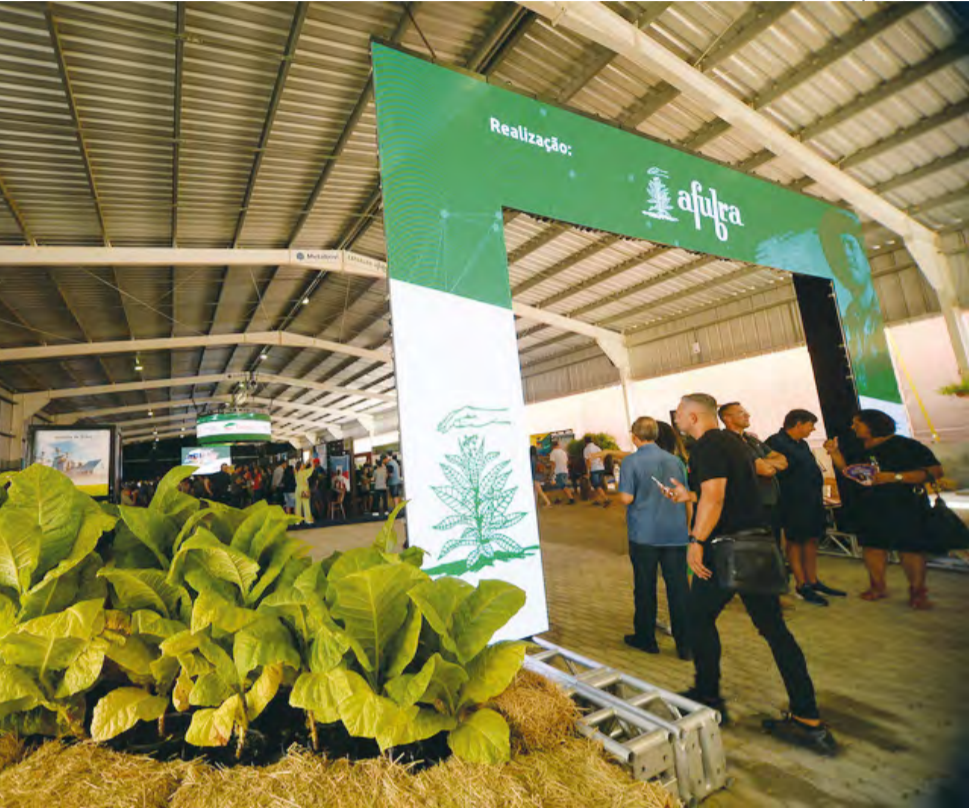
Espaço de Inovação do Agro: um local onde as atividades têm ênfase em soluções criativas, novas tecnologias, startups e educação empreendedora para o campo

A coordenação da Expoagro Afubra sempre procurou buscar novidades para a feira. Para tanto, foi criado a partir de 2022, o Espaço de Inovação do Agro, um local onde as atividades têm ênfase em soluções criativas, novas tecnologias, startups e educação empreendedora para o campo. E tudo isso fica em uma área de 2 mil metros quadrados junto ao pórtico do Parque de Exposições. Para a edição de 2024, novos elementos fazem parte da programação dos quatro dias de feira, reunindo exposições, atividades permanentes e painéis, pitches, demonstrações e palestras em duas arenas (palcos separados e com programação concomitante).