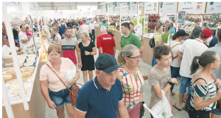
Visitante encontrará produtos de origem animal e vegetal, bebidas, artesanato rural e plantas

As agroindústrias participantes da Expoagro Afubra fazem parte do Programa Estadual da Agricultura Familiar (Peaf), coordenado pela Secretaria de Desenvolvimento Rural e executado pela Emater/RS. Por meio do Peaf, é estimulada a participação dos produtores nos mercados institucionais, são oferecidos serviços de orientação e suporte técnico para regularização sanitária e ambiental e disponibilizados os espaços de comercialização, como é o caso das feiras regionais e estaduais.