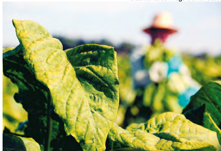
Pauta geral da reunião tratará sobre temas relacionados à produção e ao mercado mundial de tabaco