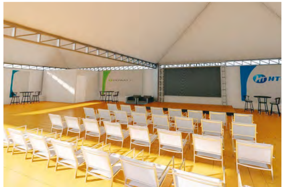
Espaço terá ampla série de palestras ao longos dos quatro dias da feira agropecuária