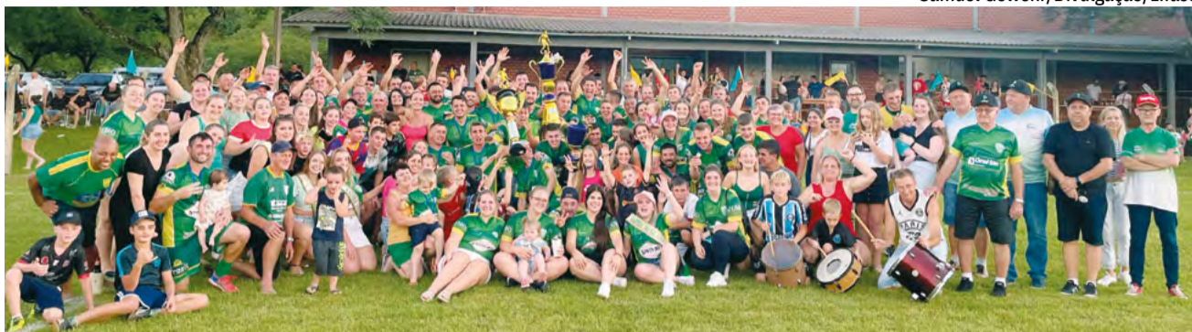
Campeões levaram a taça nos pênaltis, após empates no tempo normal e na prorrogação

Esta foi a quarta vez na história da Lifasc que o Linha Nova se sagrou campeão do segundo, sendo a terceira de maneira consecutiva. A equipe levantou o caneco nas edições de 2007, 2019, 2022 e 2023. A Copa Instituto Mix – Taça Laureno Saath contou com dez equipes e teve início em agosto do ano passado.