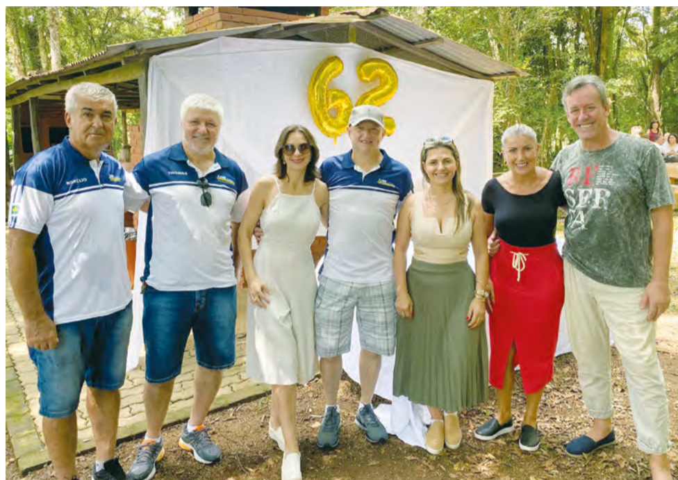
Integrantes da Diretoria AABB Santa Cruz do Sul

Esta edição contou com a participação de um grande público e diversas atrações como, apresentação musical do Grupo Tchê Aproxima, churrasco com acompanhamentos, brinquedos infláveis, torta de sobremesa e chope da Heilige.