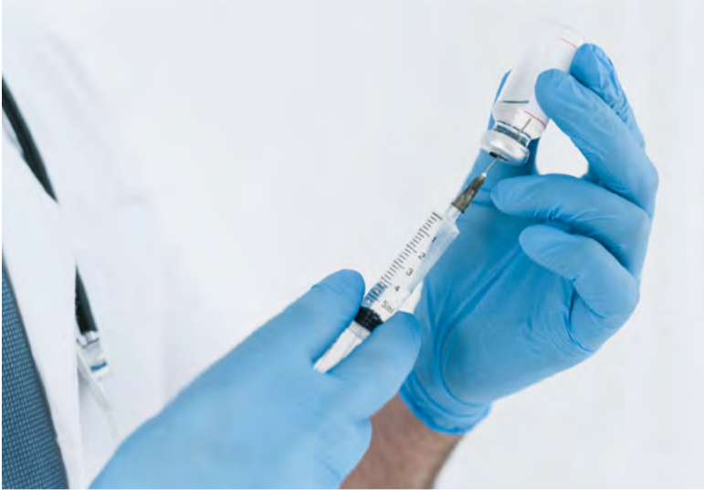
A vacinação é a principal forma de proteção contra as doenças

ses hábitos, temos uma forma fácil, rápida e extremamente efetiva para se proteger das doenças respiratórias, que é com a vacinação! A vacinação é a principal forma de proteção contra as doenças, no caso das doenças respiratórias temos a vacinação contra a gripe e também contra a Pneumonia como forma mais efetiva e eficaz de proteção contra essas doenças.