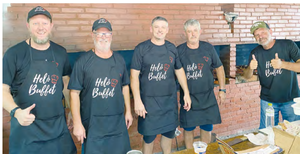
Os responsáveis pelo churrasco