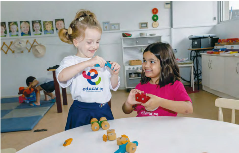
Método de ensino incentiva os alunos a serem autônomos, criativos, críticos e responsáveis na sociedade

O posicionamento da Escola Educar-se é claro: ela se vê como uma instituição que gera valor a todos os envolvidos - alunos, pais, professores e a comunidade em geral. Seu jeito é singular, sua competência, fruto da atenção aos detalhes, do aprendizado constante e dos relacionamentos. A escola abraça as mudanças com coragem e ousadia, sempre estimulada pela inovação. Sua personalidade, criativa, confiante, acolhedora, acessível, disciplinada e empática, juntamente com os arquétipos do Criador e do Mago, definem sua essência e direcionam suas ações.