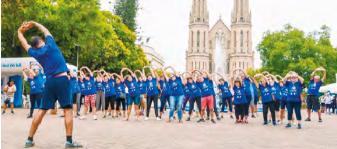
Atividades são gratuitas e há profissionais de diversas áreas

vidades contam com profissionais de diversas áreas, como educador físico, psicólogo, nutricionista, terapeuta ocupacional, assistente social, enfermeiro e técnico de enfermagem. As inscrições para participar das aulas oferecidas podem ser realizadas pelo telefone (51) 2109-9342 ou no modo presencial na sede do Centro.