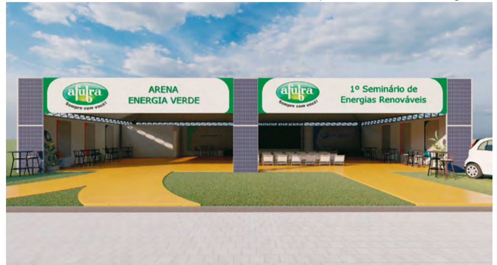
Arena Energia Verde estará localizada nos lotes 273A e 274B do Parque da Expoagro Afubra

Na manhã de quinta-feira, 21, a programação será voltada ao “Projeto Eficiência Energética nas Escolas”, conduzida pelos setores Verde é Vida e Afubra Verde