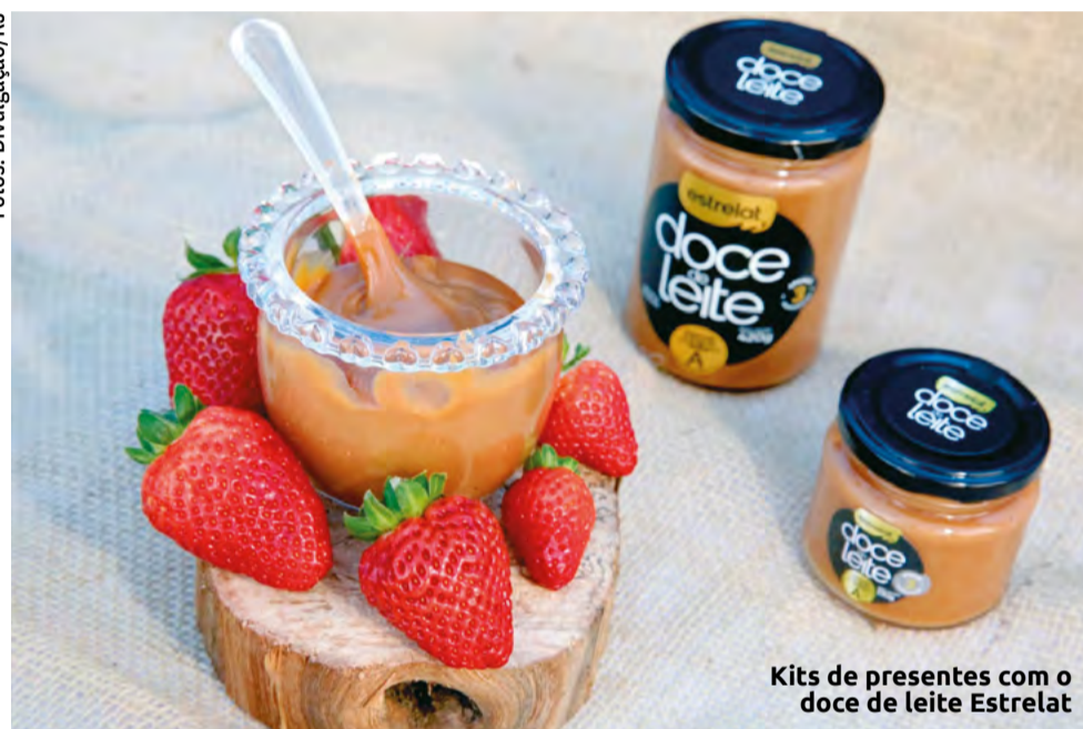
Kits de presentes com o doce de leite Estrelat

O doce de leite Estrelat já é uma referência. Já recebeu medalha de ouro, além de figurar entre os alimentos premium, sendo um dos mais diferenciados do Rio Grande do Sul em reconhecimento pelo Sebrae (Serviço Brasileiro de Apoio às Micro e Pequenas Empresas). "Divulgar nosso produto é essência. A marca é reconhecida pela qualidade. Me sinto orgulhoso e muito satisfeito em estar participando mais uma edição da Expoagro Afubra. Espero que o evento receba muitos visitantes e que possam conhecer o doce de leite Estrelat", estima Oliveira.