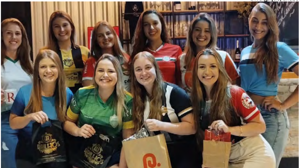
As candidatas ao título de Soberanas da Lifasc