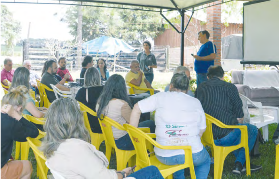
Ampla divulgação sobre a realização do seminário, assim como a participação como expositor na Expoagro/Afubra, ocorreu durante a reunião mensal da Aturvarp