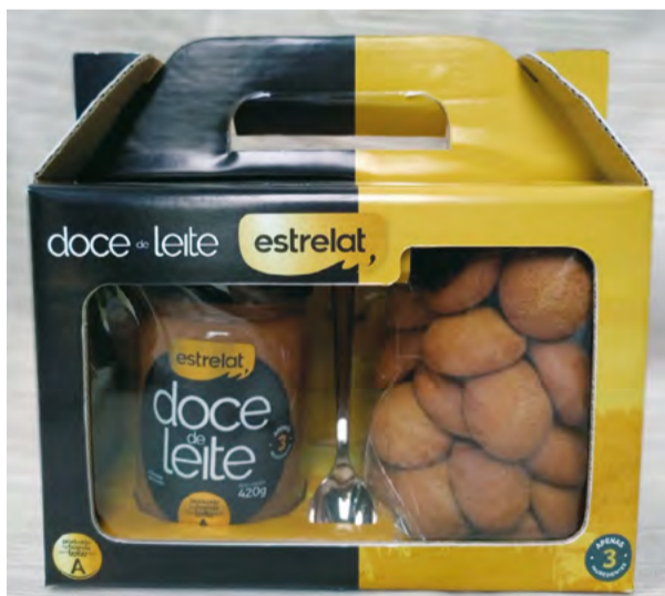
A marca já é uma referência, recebendo inclusive medalha de ouro