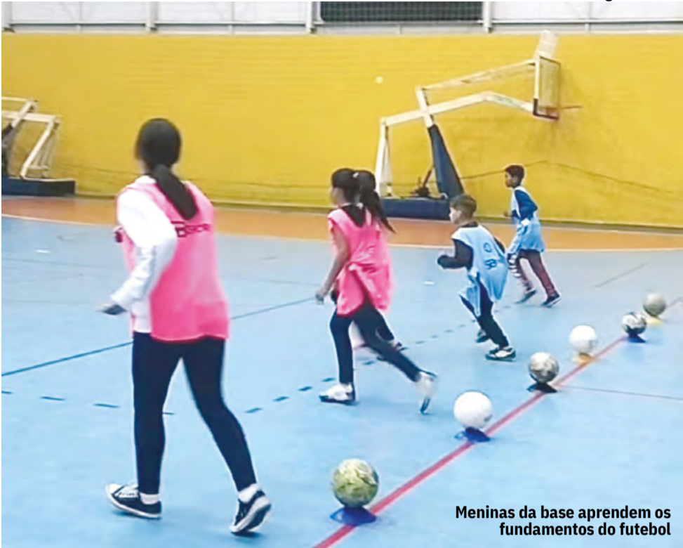
Meninas da base aprendem os fundamentos do futebol