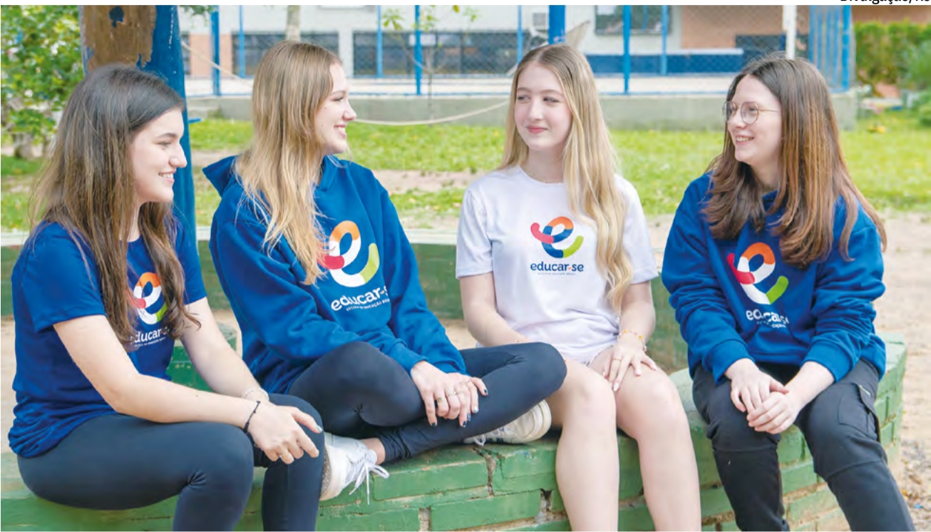
Nova identidade visual da escola, que inclui a manutenção e tonalização das cores tradicionais, juntamente com a introdução de novas cores de apoio, simboliza vibrância, diversidade e a evolução contínua da instituição

Este processo de rebranding vai além da estética; ele reflete um aprofundamento nas práticas pedagógicas inovadoras que caracterizam a Educar-se. A instituição se mantém à frente no cenário educacional, adotando metodologias de ensino que preparam os estudantes para serem pensadores críticos, cidadãos globais responsáveis e profissionais capacitados para enfrentar os desafios do futuro. Com uma proposta pedagógica robusta,