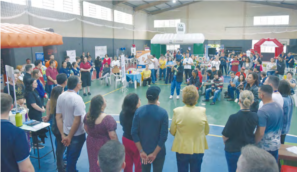
Além da oferta de vagas pelo FGTAS/Sine, através da Unidade Móvel, cerca de 35 empresas estarão instaladas no local ofertando vagas de emprego

Nesta segunda edição do Feirão de Empregos, a prefeitura participará ainda com o Conselho Municipal dos Direitos da Pessoa com Deficiência