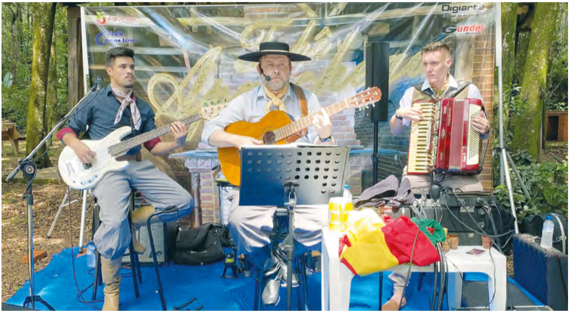
Grupo Tchê Aproxega